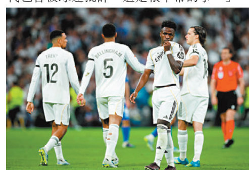
雲尼斯奧斯祖利亞入球後親吻皇馬會徽向球迷致意。