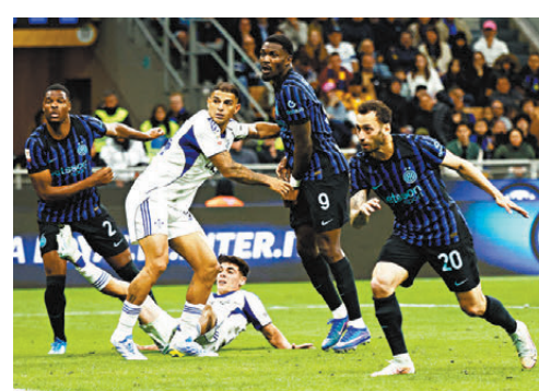
查漢奴古（右）是國米晉級最大功臣。