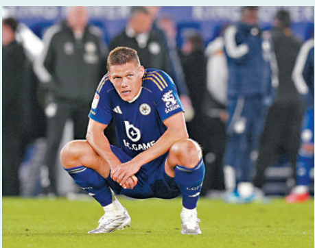
李斯特城守將維斯達加特賽後難掩失落。

香港文匯報訊（記者 楊浩然）曾在2015至2016球季贏得英超冠軍的李斯特城，在香港時間昨日（22日）凌晨英冠比賽，主場僅以2：2賽和侯城，於奪冠相隔10年之後，卻要宣布來季需降格至第三級別的英甲作賽。