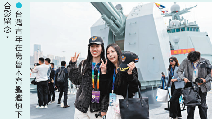
台灣青年在烏魯木齊艦艇炮下合影留念。