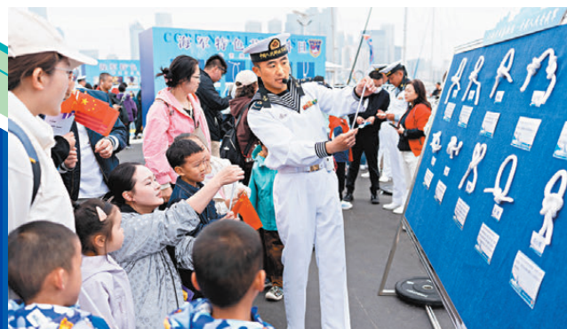
小朋友現場學習繩結技巧。