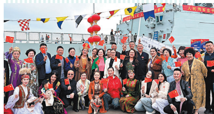
烏魯木齊市民登上以家鄉命名的烏魯木齊艦。