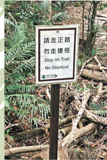
●部分行山路徑會有立牌提醒「勿走捷徑」。