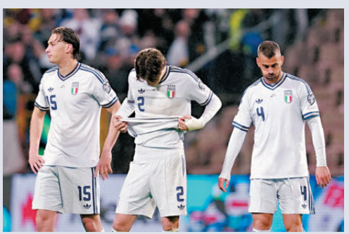
●意大利在附加賽不敵波斯尼亞，連續三屆缺席世界盃決賽周。

根據國際足協規則，若伊朗退賽，該機構擁有全權酌情決定權，可以決定由其他球隊替代參賽。不過恩芬天奴上周表示：「伊朗隊要代表伊朗人民。他們已經晉級，他們真的很想比賽，而且應該參賽。」特朗普此前聲稱，他歡迎伊朗球員赴美參賽，但暗示此舉「不合適且可能有危險」。伊朗傳媒報道，伊朗隊將按計劃備戰世界盃。