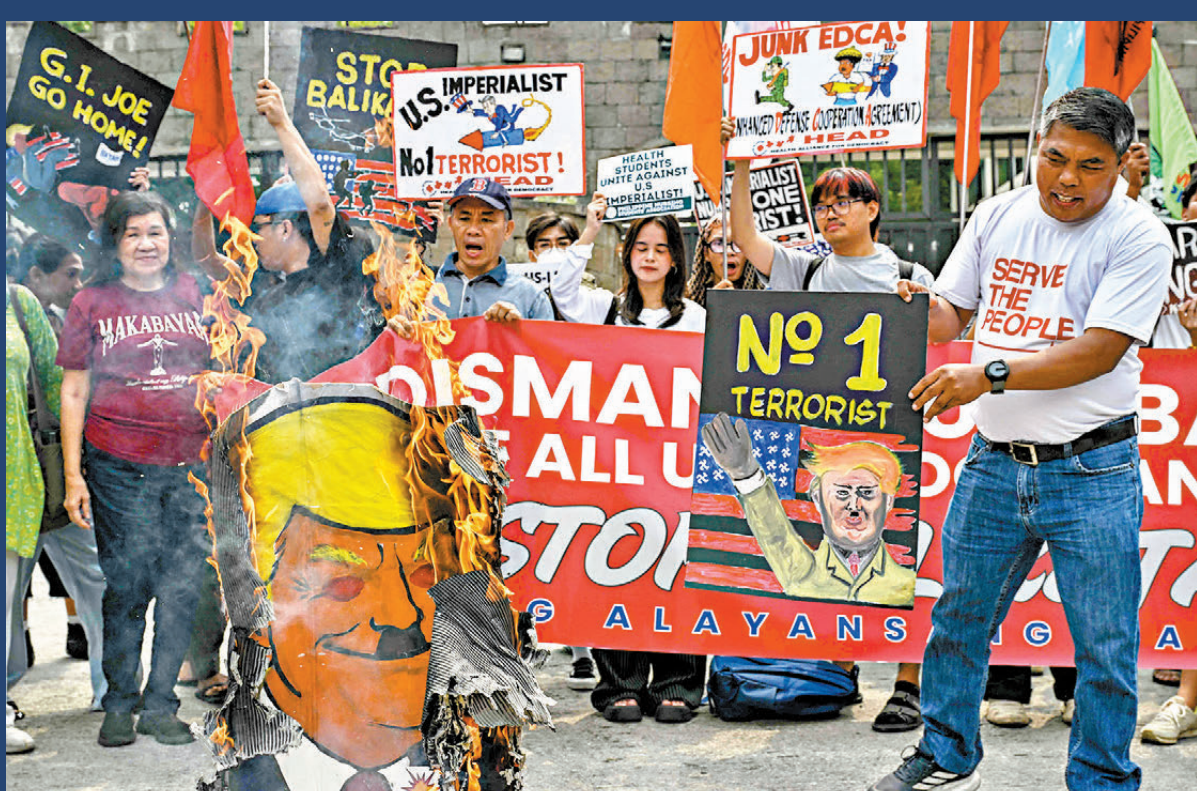
●特朗普發起對伊朗戰爭，除在國內面臨政治苦果，亦成為全球公敵。圖為菲律賓民眾發起反特朗普示威。

香港文匯報訊 美國與伊朗停火談判不見進展，美國總統特朗普22日宣布延長停火時間且不設最後期限，試圖將談判進展不順，全數歸咎於伊朗當局的內部分歧。美媒指出，特朗普政府屢揚言伊朗談判代表和伊朗軍方之間存在分歧，才導致伊朗缺席新一輪談判。但分析人士指出，美國一再堅稱伊朗內部「分裂」，更像是特朗普試圖為自己找台階，掩飾其外交和軍事政策屢屢受挫的事實。