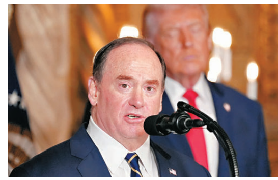
●費倫與特朗普關係密切。資料圖片

全局局長兼網絡司令部司令蒂莫西·霍、海軍作戰部長弗蘭凱蒂、海岸警衛隊司令費根等美軍高官，都相繼被解職或提前退休。美國陸軍參謀長喬治本月初也被迫提前退休。