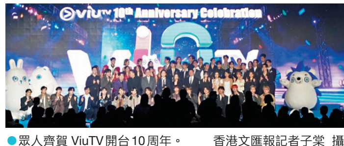
眾人齊賀 ViuTV 開台10周年。

驚：「收到消息時心想搵我做木村拓哉係咪玩我？上次是《大叔的愛》的田中圭，沒想過突然變成木村，好驚好大壓力，但這是好機會，要好好把握和做好準備。」而AK則飾演女主角Ali的弟弟。Edan表示該劇是經典神劇，無法參考木村的演出，不能作比較或模仿，因不單止是偶像劇，內裏還帶出人生等許多不同訊息，因此壓力巨大，只能做好本分，並提到自己與角色的最相似之處是都會彈琴，對與Ali首度合作充滿期待，讚對方是女神級的專業演員。Anson Lo表示能翻拍《金秘書為何那樣》感到榮幸，今次角色比三年前的霸道總裁更調皮幼稚，自評不及原版男主，並稱港版會保留原著框架，加入本地元素，親密戲尚未定案。陳卓賢則澄清社交網圖片非演唱會預告，呼籲粉絲耐心等待。COLLAR全員到場，被問及Ivy若拍《金秘書為何那樣》將可能面對床戲，隊友主動分享經驗，Ivy笑言劇集初物會否獻出尚未確定，認為最重要的是劇集好看，及與劇組合作愉快。7位成員希望能在音樂以外有全員合作的作品。