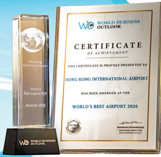
●香港國際機場獲 World Business Outlook Awards 2026 的「全球最佳機場」殊榮。