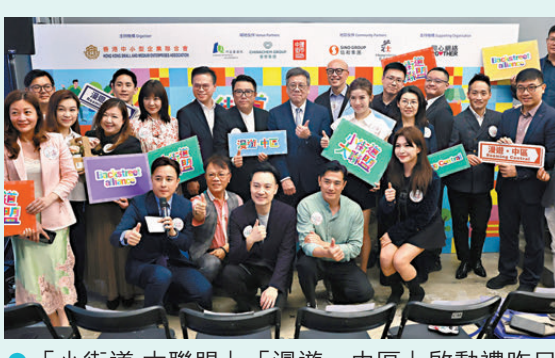
●「小街道大聯盟」「漫遊·中區」啟動禮昨日舉行。

他同時強調，市建局推動舊區更新，除改善環境外，亦致力為舊區注入人氣與財氣，結合「改善環境、帶動經濟、加強社區聯繫」三項元素，推動舊區可持續發展，如上月便聯同地區組織、新網絡推出首屆「2026嘉咸節」，聯動近100個中環嘉咸街商戶及周邊商戶，與逾300名香港職業訓練局青年學院的學生，以全新角度演繹嘉咸街百年市集的獨特魅力，共創「嘉咸」品牌以彰顯地區特色，推動本港文化旅遊的發展。活動期間，人流明顯上升，假日消費氣氛熱烈，參與商戶生意錄得雙位數增長。