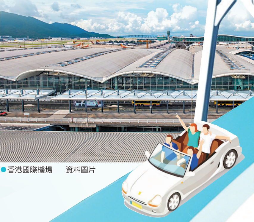
●香港國際機場 資料圖片

航空數據機構 OAG 公布 4月全球10大最繁忙國際客運航線 4條涉及香港國際機場 分別為： 香港往來台北(第一) 香港往來曼谷(第六) 香港往來馬尼拉(第七) 香港往來首爾仁川(第九)