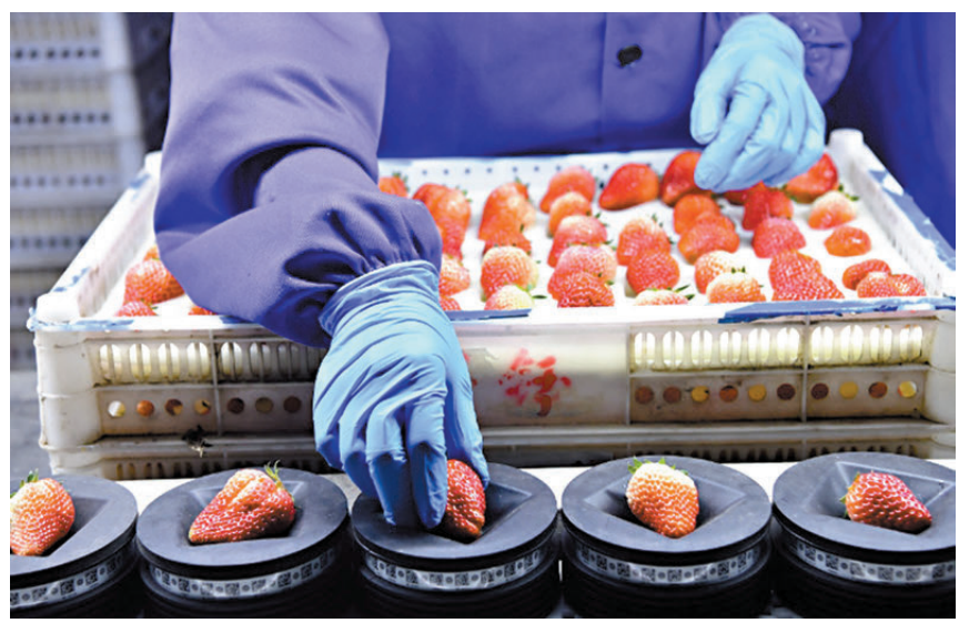
●智能分選與人工分選相結合，丹東草莓可以實現「無限分級」。