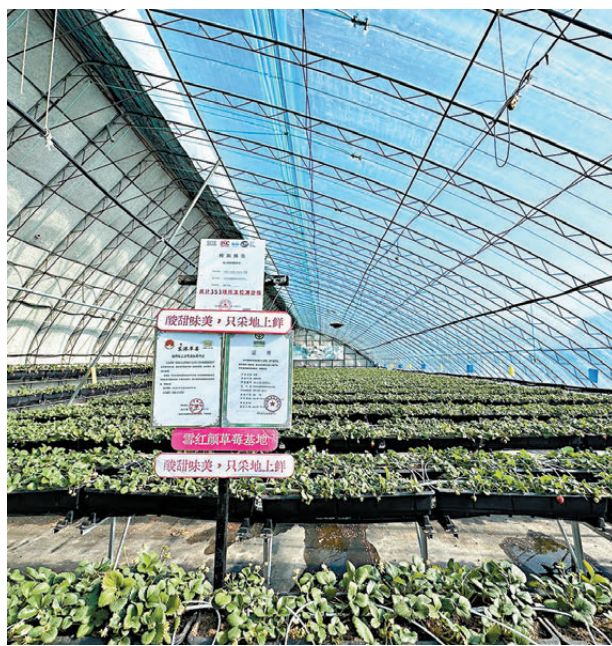
●丹東東港的現代化草莓大棚內，國家地理標識格外醒目。