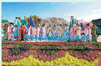
●國風漢服緩緩穿行街巷，衣袂翩翩，與古觀青山相映成趣。