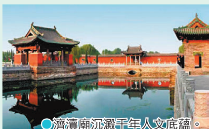
●濟濟廟沉澱千年人文底蘊。

古利始建於隋代，殿宇錯落，古柏參天，碑刻林立，青磚黛瓦承載千年風霜。庭院清幽靜謐，遠離人潮喧囂，穿行其間品讀古建匠心，溯源濟水文脈，在靜謐古韻中讀懂濟水源遠流長的人文積澱。