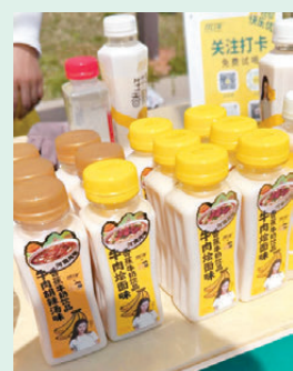
●市集上偶遇胡辣湯味牛奶。

王屋山土饅，是大山饋贈的原生風味。取用王屋山獨有土質烘炒製成，口感乾爽酥脆，細嚼慢品漸生山野獨有的清潤回甘。古時山民以此養胃充飢，如今則成為濟源代表性的伴手禮，便攜耐存，既可山間漫遊隨手解饑，亦可浸入熱湯同食，風味醇厚。糝合豫晉風情的肉夾火燒，外皮焦香，肉肉醇厚，一口解鎖中原地道風味；春日限定的炒碾轉，取新麥本味，清鮮爽口，是獨屬於中原大地的時令浪漫。漫遊濟源街巷，於煙火繚繞間細品本土滋味，山河養眼，美食暖心，讓這場濟源仙山之行豐盈而完整。