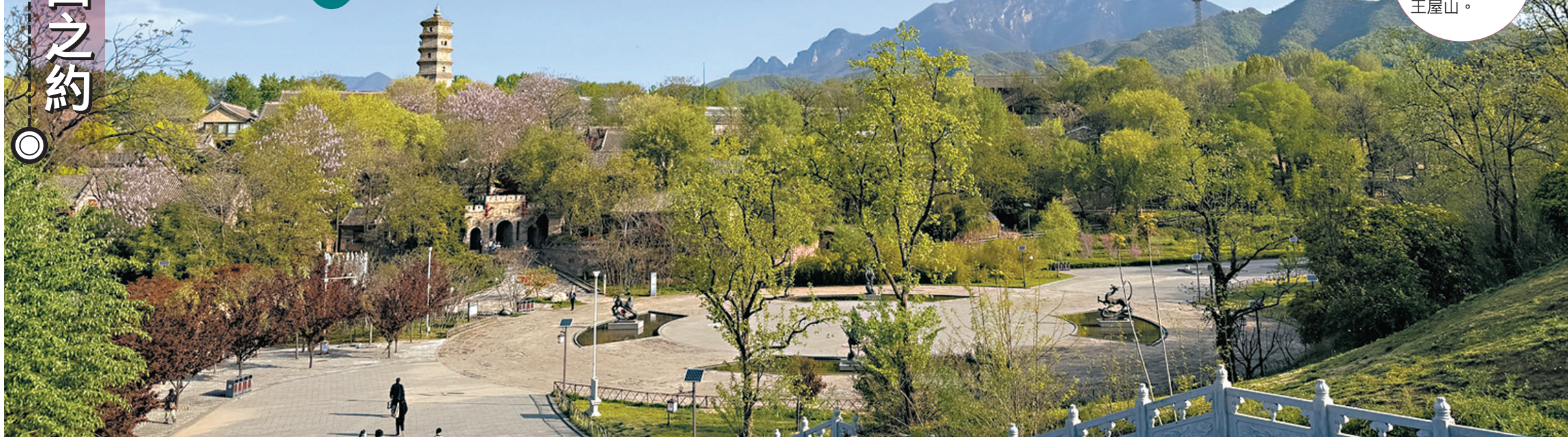
●王屋山文化旅遊節啟幕。