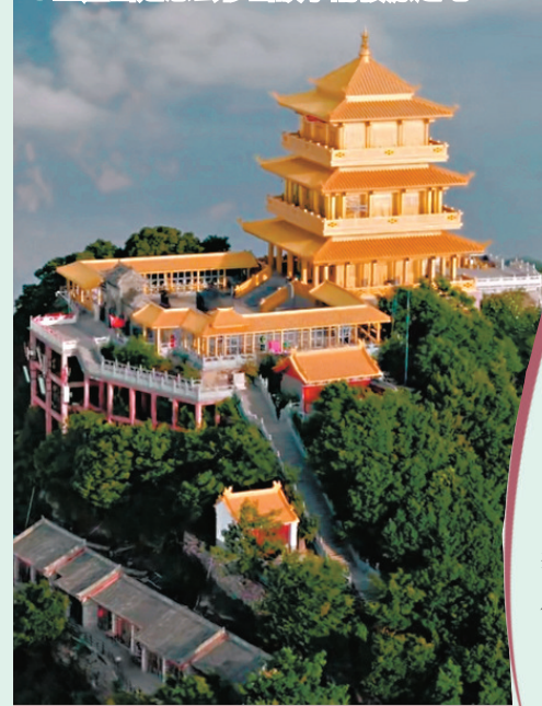
●王屋山是愚公移山故事的發源之地。

濟源之美，不止王屋一山盛景。這片銜太行、臨黃河的天地，集雄山大川、千年古建、河川奇觀、田園茶韻於一體，自然之雄與人文之雅相融，串聯全域漫遊，盡覽濟源多元風情。