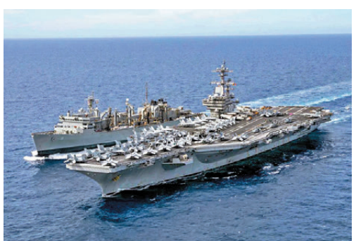
●「布什號」打擊群24日抵達伊朗附近水域。

香港文匯報訊 美國航空母艦「布什號」打擊群24日抵達伊朗附近水域，旨在施壓伊朗放棄核計劃、重開霍爾木茲海峽並結束戰爭。美媒報道，此舉增強美國總統特朗普在與伊朗進行談判期間可動用的軍事力量。