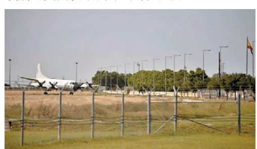
●美國西班牙聯合空軍基地。

霍爾木茲海峽恢復暢通，並揚言考慮讓美國退出北約，不過該官員表示，電郵並未建議美國這麼做，也沒有提議關閉美軍在歐洲的基地，但他拒絕透露選項是否包括外界普遍預期的美國從歐洲撤出部分兵力。