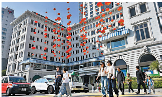
●黃金周假期期間，香港酒店訂房率預計超過九成。圖為尖沙咀半島酒店。

另外，黃金周前後已有不少店舖及商場推出多項面向旅客的推廣活動及優惠，如YOHO MALL形點商場本月17日至6月30日推出旅客專屬電子購物券及指定商品換購優惠；時代廣場即日起至5月31日與支付寶合作，向內地支付寶用戶提供消費即時扣減等優惠，冀吸引假期人流並帶動消費。