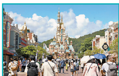
●旅客在香港迪士尼遊玩。資料圖片