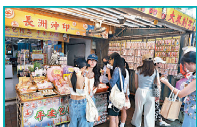
●旅客在長洲購買紀念品。資料圖片