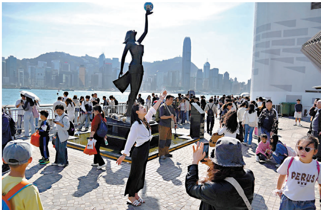
●羅淑佩指香港各項盛事可提升旅客訪港意慾，以及延長留港時間。圖為遊客在尖沙咀星光大道拍照。資料圖片

羅淑佩表示，預計五一黃金周期間有約98萬名內地旅客訪港，較去年的人數增約7%，但實際數字仍要視乎天氣因素。近日，她已和多個景點，以及旅遊和酒店等業界代表聯繫，而業界均對黃金周市道有信心，其中酒店訂房率預計超過九成，具體數字要「這個禮拜見真章」，因跨境交通便捷，不少旅客或臨近假期才確認行程，預料訂房情況會再「衝刺」，政府會做好準備以及服務。