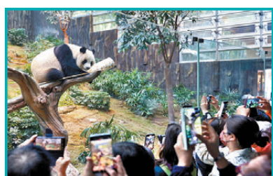
●旅客在海洋公園看熊貓。資料圖片