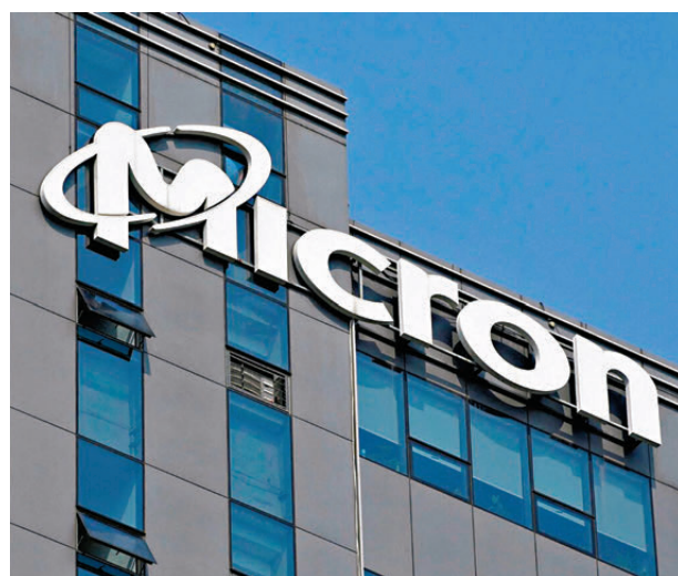
▲美國最大記憶體晶片製造商美光科技（Micron Technology）。