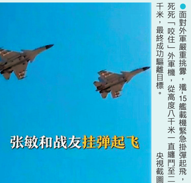
●面對外軍嚴重挑釁，殲15艦載機緊急掛彈起飛，死死「咬住」外軍機，從高度八千米一直纏鬥至二千米，最終成功驅離目標。央視截圖

不止遼寧艦，山東艦編隊巡弋台島以東海空域時，亦遭遇外軍艦機輪番滋擾。編隊萬噸大驅前出佔位，協同殲-15艦載機聯動處置、聯手驅離。2026年3月解放軍披露視頻顯示，山東艦編隊在台島以東巡航時，延安艦突遭外軍電子戰飛機強電磁干擾。該艦立即啟動電子對抗系統，協同殲-15艦載機精準定位干擾源，成功驅離目標。後續外艦企圖抵近窺探山東艦，延安艦高速機動截停，官兵坦言「已做好犧牲準備」，最終迫使外艦轉向撤離。