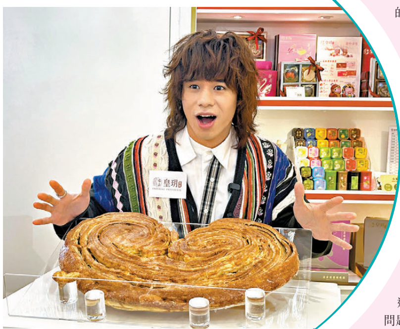
●曾比特與家人人都喜歡吃糕點。

至於日前化身清潔工人，到尖沙咀星光大道為英皇歌手的展覽品做清潔，他表示這個主意是他與公司一起構思出來的，並且很開心能為一個為師兄師姐服務的小師弟，更笑言最開心的是未被人認出時，有路人稱讚他靚仔並要求合照。他透露正忙於為5月公司舉行的大型演出馬不停蹄地做準備，因為將與多個不同單位合作，所以要做足準備功夫；加上這次有一定壓力，畢竟是加入新公司後的首個大型演出，也是首次踏上可容納數萬人的體育主場館。