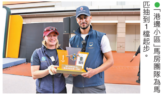
●「港邊小區」馬房團隊為馬匹抽到1檔起步。

英國代表「港邊小區」去年出戰香港一哩錦標，以86倍大冷門姿態跑獲殿軍，表現令人驚喜。此駒相隔四個月再度征港，策騎員Laura受訪時表示，上仗在港已期望能打入前列，最終奪得第四可謂如願以償，今仗同樣期待牠維持水準。Laura亦提到，這匹六歲馬適應遠征能力極佳，無論環境與賽程如何變動，都有能力穩定發揮。此外，今次抽籤牠幸運獲得1檔，Laura對此十分滿意，直言相比外檔，自己更偏向選擇內檔，這點有利馬兒競逐，也對今場賽事更具信心。