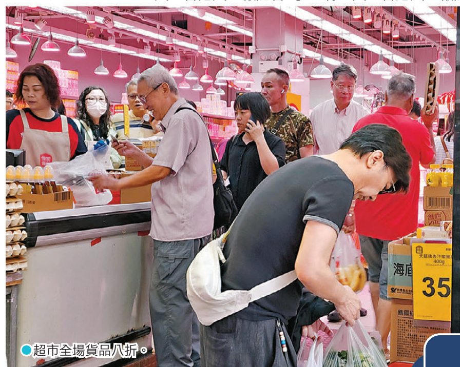
●超市全場貨品八折。

兩大超市早前推出限時快閃八八折優惠，打響超市減價戰第一槍。隨後，佳寶推出為期7天的八折優惠迎戰，戰火更由實體門店蔓延至網店市場，HKTVmall昨日推出八五折優惠，涵蓋超市、個人護理、美妆、寵物及母嬰產品，只要上述類別產品消費滿999元，輸入優惠碼便能享有折扣優惠。此外，HKTVmall更預告續推更多驚喜優惠。