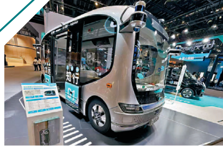
●文遠知行推出的自動駕駛小巴。

香港文匯報訊 綜合光明日報報導，本次北京車展現場，一個值得關注的信號是：大量智能駕駛供應商首次大規模進入主展館，與整車品牌同台展示。過去，供應商往往藏在幕後，在偏僻的零部件展區。今年，它們直接站到了聚光燈下。業內人士表示，「智能新能源汽車快速發展的這幾年，海外傳統供應商明顯跟不上中國車企對智能化技術的迭代速度。這就給了國內供應鏈一個絕佳的升級機會。」