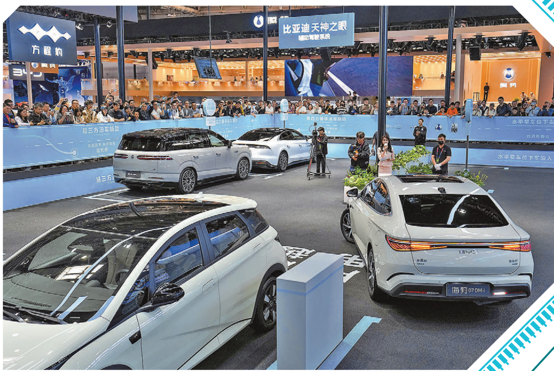
●北京車展上，自動駕駛正從高端車型的專屬配置走向大眾。圖為參觀者在參觀比亞迪輔助駕駛系統的自主泊車展示。新華社