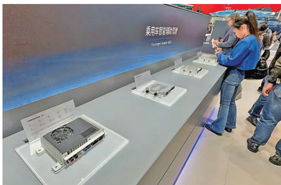
▲卓馭科技研發的乘用車智能輔助駕駛系統部件。

過去，中國汽車晶片市場一度被國際巨頭主導，部分自主品牌車企受制於海外供應鏈，成本居高不下。本屆北京車展上，搭載國產自研晶片的量產車型超40款，國產晶片滲透率穩步攀升。一汽發布「紅旗1號」，作為內地首輛車規級多域