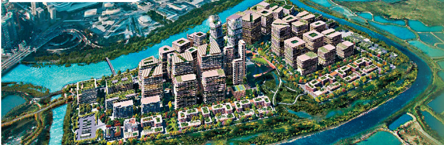
製表：香港文匯報記者 高鈺