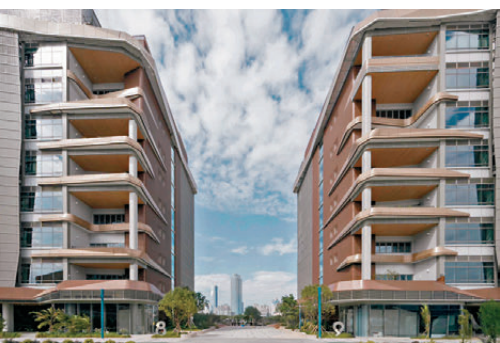
●港深創科園吸引多間海外生物科技企業進駐。