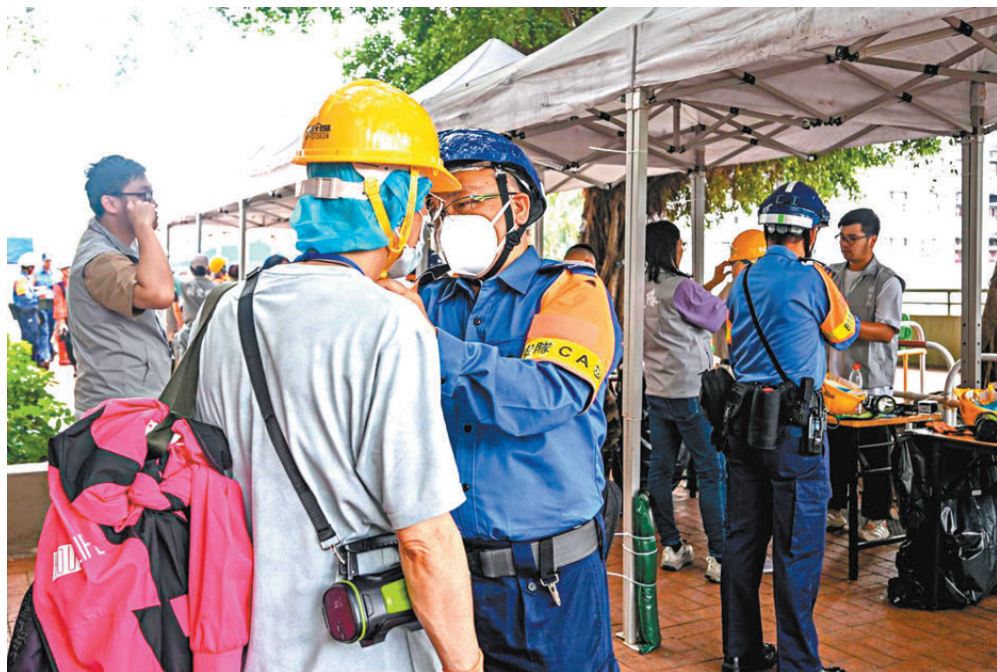
●今次協助宏福苑居民分批上樓執拾物品的行動中，民安隊每天約出動150名隊員，負責陪伴居民返回單位、協助居民上下樓梯、安排急救人員在樓宇內巡邏待命。