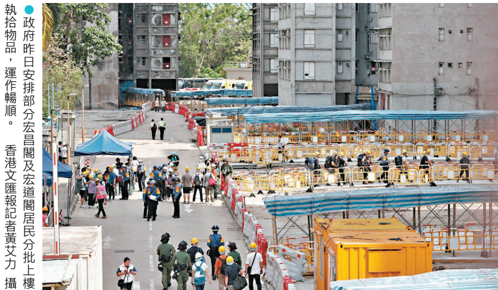
●政府昨日安排部分宏昌閣及宏道閣居民分批上樓執拾物品，運作暢順。

梁先生又表示，上樓前社工多次表達關心，提醒居民量力而行，按體力慢慢上落，「不要急，慢慢走」，沿途亦可補充水分。若有需要，社會協助安排心理支援服務，「政府的確幫了我們很多。」