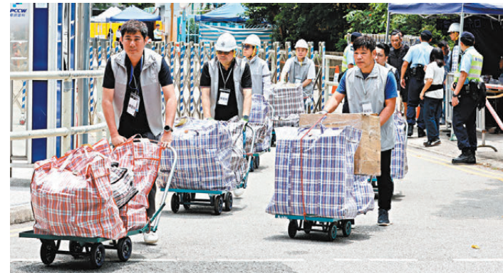
▲關愛隊隊員協助上樓的居民搬離單位內的財物。

另一方面，昨日登記上樓的戶數是116戶、403人；實際有出現上樓的戶數是119戶、443人。他們進出大廈的平均逗留時間2小時32分鐘，最短17分鐘，最長的是3小時45分鐘。昨日總共有60戶、124人上落大廈不止一次，最多3戶3人多走5次。