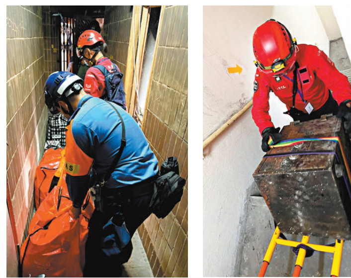
●民安隊隊員協助居民把單位內大件物件，一袋袋運送到地面。 ●要把幾十斤重的保險櫃從十多樓搬到地面，民安隊隊員義不容辭。

列日下，各政府部門人員汗流浹背來回穿梭於宏福苑獲開放的樓宇，只要居民有需要，就會見到他們的身影，從不遲疑。民安處行動及訓練主任（特遣部隊）陳顯然昨日向香港文匯報記者介紹，民安隊在今次行動中每日大約出動150名隊員，每天在崗大約12小時至13小時，主要負責陪伴宏福苑居民返回單位、協助居民上下樓梯、安排急救人員在樓宇內巡邏待命、陪同未能上樓的居民到指定等候點，以及成立前線指揮中心統籌現場行動及支援工作。