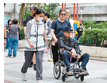
▲社署人員為居民提供支援。