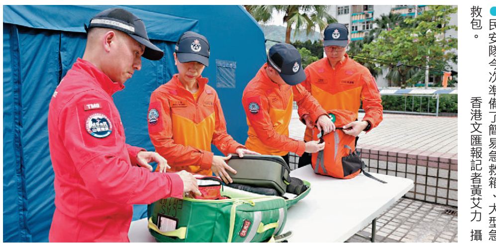
●民安隊今次準備了簡易急救箱，大型急救包。