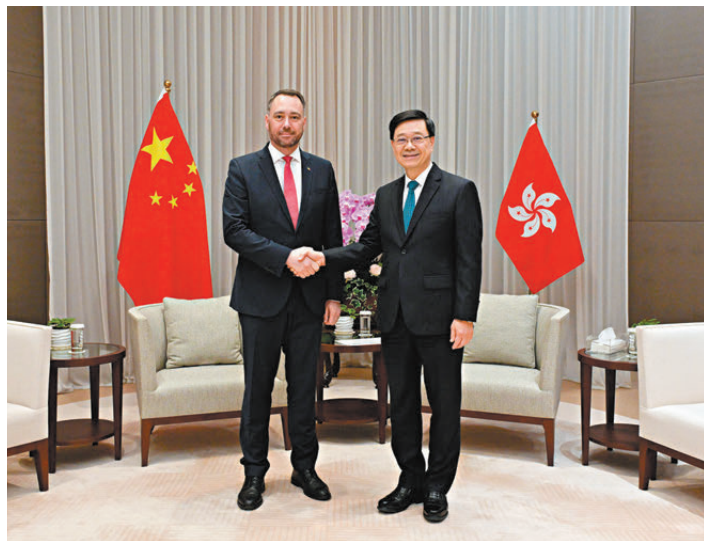
●行政長官李家超昨日與比利時副首相兼外交大臣普雷沃(左)會面。

香港文匯報訊 香港特區行政長官李家超昨日與比利時副首相兼外交大臣普雷沃會面，就深化香港和比利時合作交流意見。香港特區政府署理財政事務及庫務局局長陳浩濂亦有出席。李家超歡迎普雷沃率團訪港，並指比利時是香港在歐盟的主要貿易夥伴之一，多家比利時企業在香港設立業務據點，今年適逢比利時駐港總領事館成立100周年，體現兩地往來、合作頻繁。香港作為國際貿易中心，在最自由經濟體排名穩居世界第一，是全球第五大商品貿易經濟體。他有信心雙方會在經貿投資、創新科技和人文交流等領域進一步加強合作，開創更廣闊的合作空間。