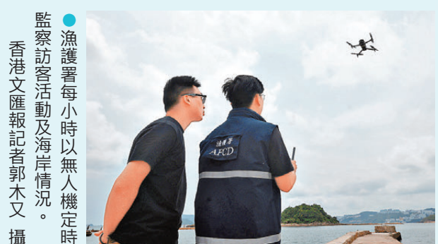
●漁護署每小時以無人機定時監察訪客活動及海岸情況。