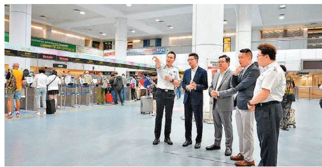
●入境處副處長程和木與助理處長樊曉聲昨日視察三個管制站，了解應對出入境客流的準備工作。

據旅監局和業界的估算，黃金周期間約770個旅行團入境香港。旅監局已提醒接待內地入境旅行團的旅行社代理商盡量分散入境時間，並協調景點等相關單位採取適當分流措施。