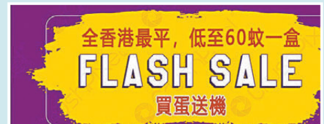
電子煙網店廣告聲稱「當實體商店成為過去,我們依然繼續為你服務」。網絡截圖

記者憑有關線索,順利以顧客身份透過微信聯絡該網店賣家,對方表示有煙彈可以售賣,預計「星期一可以派送」,又指記者訂單已滿500元,可以免費運送。當記者問及4月底法例實施後,對方能否繼續送貨時,賣家更表明早已做好準備:「請放心,會安全送達,送到你們提供的地址。」對方更進一步解釋,他們會包裝成其他