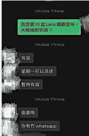
▲記者以顧客身份透過微信 ▲賣家指記者訂單已滿500元,可以免費運送。網絡截圖