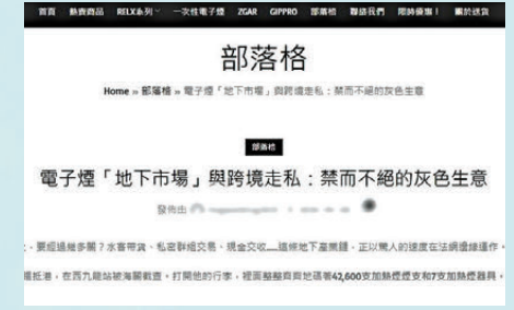
●網店撰文向賣家教路,如何透過Telegram等平台應對禁令。網絡截圖

們「不要一上來就硬銷」、「可以先分享電子煙知識、設備測評、安全使用指南等中性且有價值的內容」、「建立專業和可信賴的形象」,繼而再一步步吸引對方成為顧客。