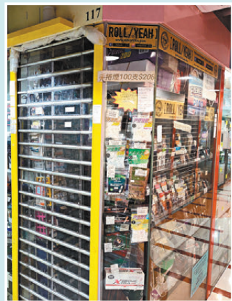
●深水埗商場手捲煙專門店門口標明沒有電子煙出售。