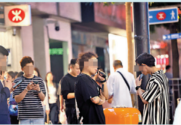
●4月30日起,任何人不得在公眾地方管有指明另類吸煙產品,包括電子煙、加熱煙及草本煙。 資料圖片

該負責人在閒談中告訴記者,這幾款電子煙很受歡迎,「它們賣得很快的,雖然還有一半貨未售完,但估計(4)月底前差不多賣完。」當記者問及未賣完怎麼辦時,他笑說:「如果賣不完就自用,賣完後短期內不會再賣,要看看之後有什麼情況,如果風聲太緊就暫時不賣。」記者再問4月後能否送貨上門,他表明暫時應該比較困難,因為很多物流公司都不再送貨。「不過如果住在附近,可以託人送貨,但要另外再給運費。」