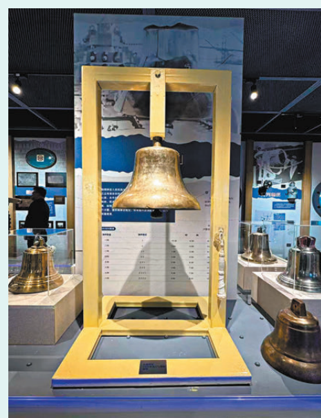
●密蘇里號軍艦的銅鐘。