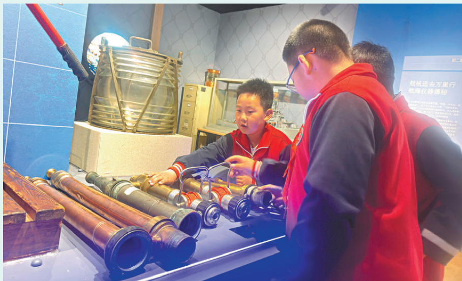
●小學師生參觀展覽，在體驗中學習航海知識。