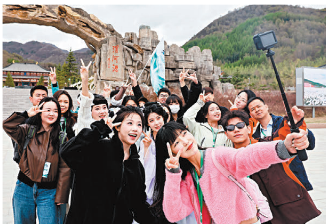
●「五一」假期臨近，各地文旅市場持續升溫。圖為文旅達人在甘肅省定西市渭河源景區打卡。

消費周推介會還發布了全國「五一」賞花旅遊地圖。中國氣象局國家氣候中心聯合華風氣象傳媒集團結合賞花花品類、