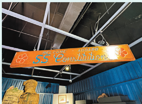
●中國現代航運先驅、世界船王董浩雲的遊輪上拆解下來的船區。