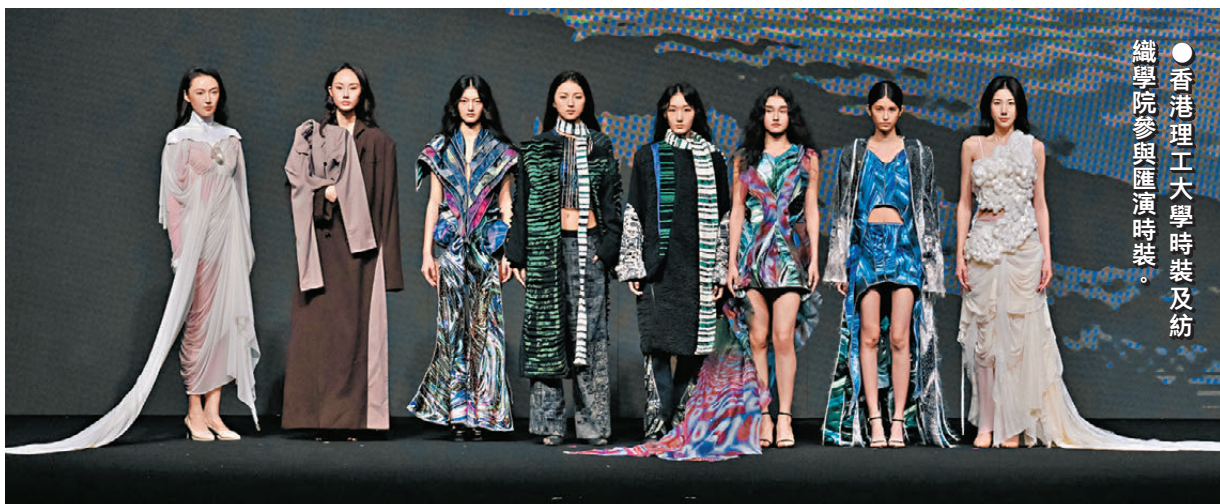
●香港理工大學時裝及紡織學院參與匯演時裝。