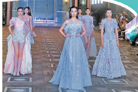
◀在「2026 廣東時裝周一春季」，「香江1號時尚藝術高訂大秀」亮相。