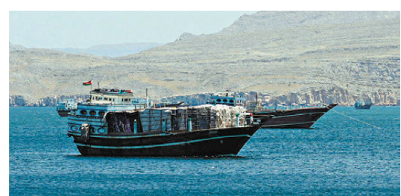
●霍爾木茲海峽船舶通航量有所上升。

頭，有兩艘油輪正在裝載原油，總裝載能力約300萬桶。與此同時，在哈爾克島南部和東部海域至少有8艘超大型油輪錨泊，是明顯的等待隊列。報告認為這表明伊朗原油出口仍在持續，但受到裝卸節奏、基礎設施能力及美軍封鎖等因素制約。