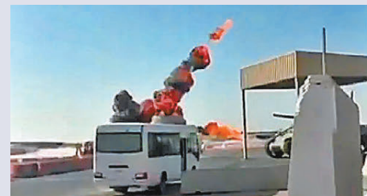
●伊早前襲擊科威特勃林陸軍基地。

美國國防部極力淡化遠超預期的戰損。報道指出，國防部甚至私下要求私營衛星圖像公司，限制其獲取海灣地區美軍基地影像。有匿名國會助理坦言：「數周來我們一直得不到具體細節，國防部卻還在要求創紀錄的高額預算。」