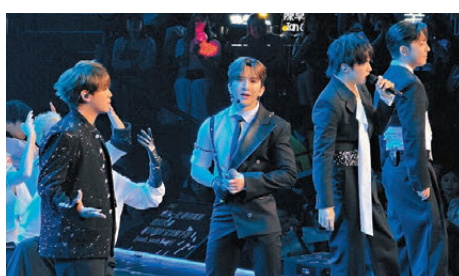
●MIRROR 4子合體演繹《Sheesh》。

香港文匯報訊(記者 子棠)「2026 WIEA 微博國際娛樂盛典」於4月25日至26日假澳門銀河綜藝館舉行。盛典雲集來自中國內地、香港、韓國及泰國等地共十八組超人氣藝人，星光熠熠。