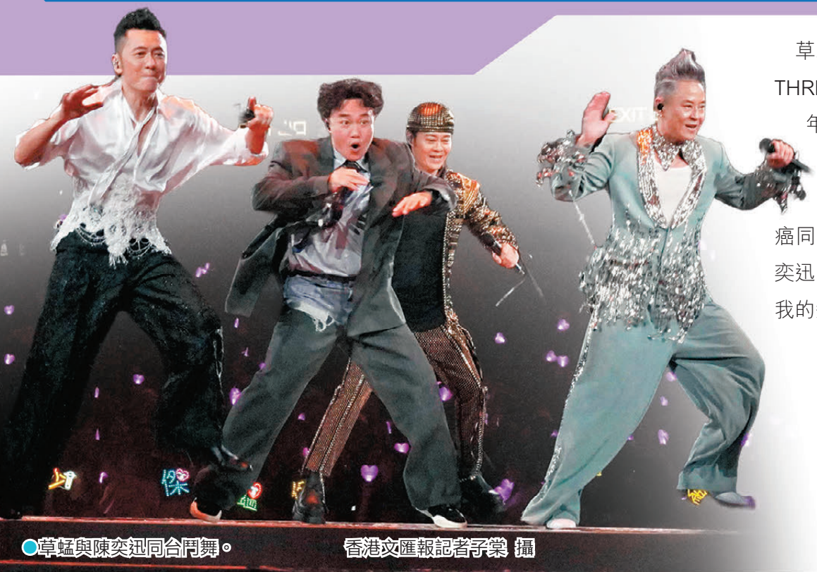
●草蜢與陳奕迅同台鬥舞。香港文匯報記者子棠攝

草蜢前晚於紅館舉行首場「GRASSHOPPER THREE IN LOVE 演唱會2026」慶祝成軍40周年，蘇志威、蔡一智(阿智)與蔡一傑(傑仔)以勁歌熱舞揭開序幕；傑仔狀態大勇，首度公開抗癌歷程，並數度抹淚，他鼓勵抗癌同路人樂觀不放棄，及時行樂。首場嘉賓陳奕迅(Eason)笑言討厭蘇志威：「因為他搶走了我的劉小慧！」 ●香港文匯報記者 子棠