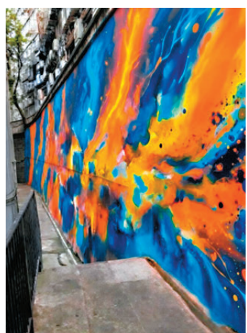
●榮華里擋土牆壁畫電腦模擬圖。

第二階段會先進行「社區營造」研究，與地區和其他持份者討論蘭桂坊未來應該採用什麼設計主題等，以大規模地應用在美化工程和措施上，透過一致的設計元素建立蘭桂坊品牌。