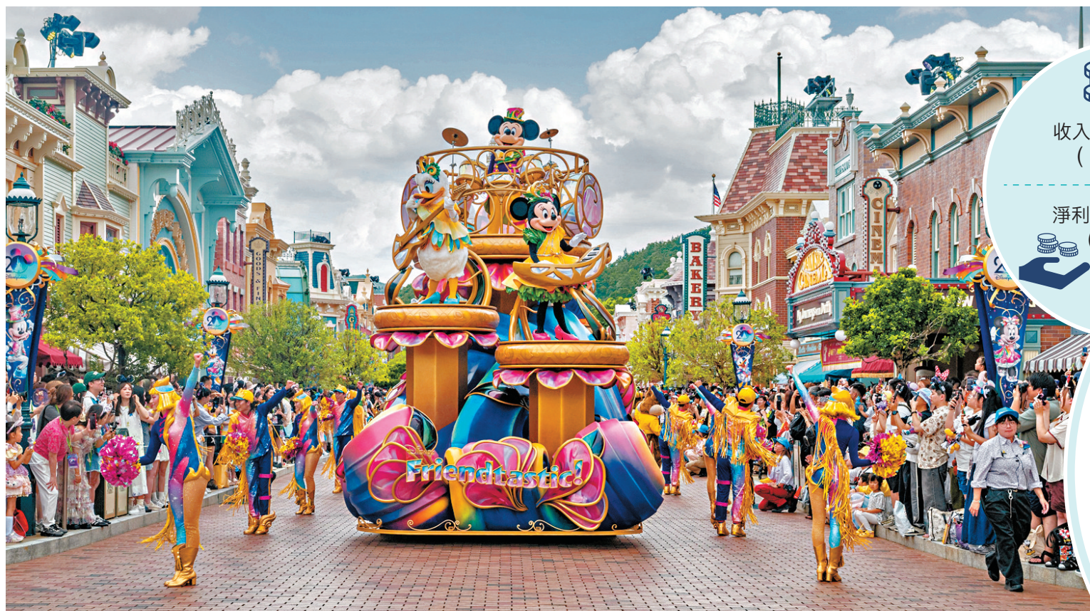
●香港迪士尼2025財政年度總入場人次達750萬，為開園以來第二高。

作為香港熱門旅遊景點的香港迪士尼樂園，是旅遊業復甦的寒暑表，香港迪士尼昨日公布2025財政年度業績，樂園入場人次為750萬，是2005年開園以來第二高，而收入、未扣除利息、稅項、折舊及攤銷前盈利及淨利潤均接近歷史高位。在2025財政年度完結前，香港迪士尼已向股東全數償還所有貸款，首次實現「零貸款」。對於2026財政年度，香港迪士尼保持樂觀，預計入場人數、收入等強勁表現將持續延伸，並預告將推出「魔雪奇緣世界」雪人小白機械人、全新Pixar主題及Marvel主題體驗等，有信心繼續擔當大灣區重要的旅遊目的地。