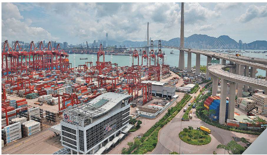
●政府發言人表示，全球對人工智能相關電子產品需求維持堅挺，應為香港商品出口表現提供有力支持。