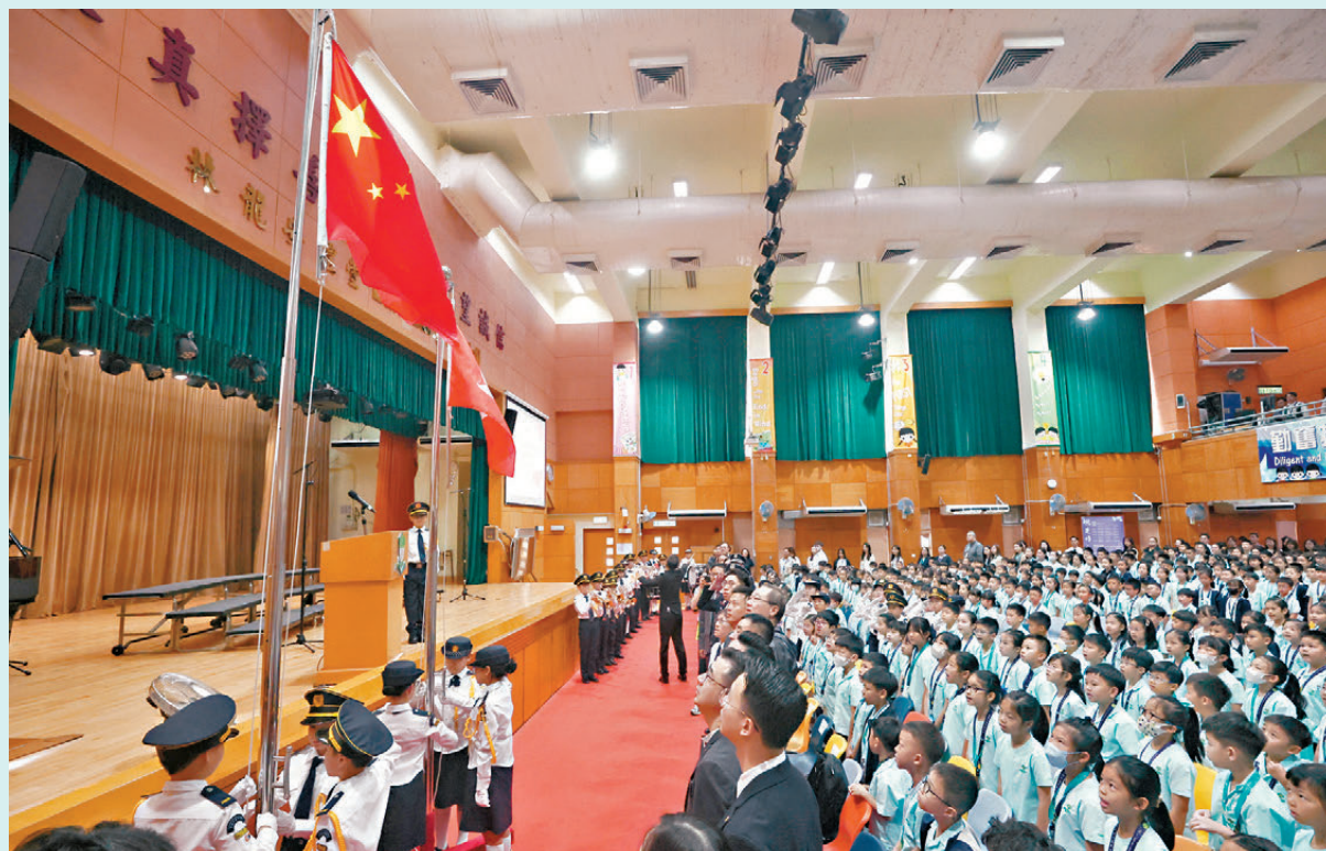
●國家安全教育不再局限於單一課堂，而是延伸至整個校園教育場景，使相關內容成為學校整體推展國安教育的一部分。圖為中學升旗禮。資料圖片