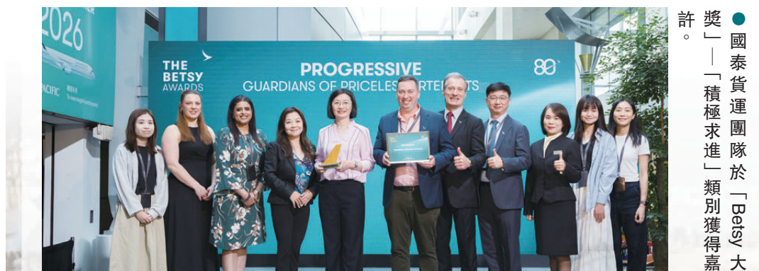
●國泰貨運團隊於「Betsy大獎」——「積極求進」類別獲得嘉許。

4月16日，國泰年度員工最高榮譽「Betsy大獎」頒獎禮於國泰城舉行，今年近千名員工獲嘉許，人數較去年翻倍。獲得「積極求進」類別獎項的國泰貨運團隊憑藉對誤差的「零容忍」態度，將十尊真人大小的秦俑及兩百多件珍貴文物從西安經香港安全運抵澳洲珀斯。這趟橫跨逾七千公里、被西澳博物館盛讚為「世界級水平」的護航任務，不僅展現國泰連接中外文化的專業實力，亦揭開這場運輸背後的動人故事。