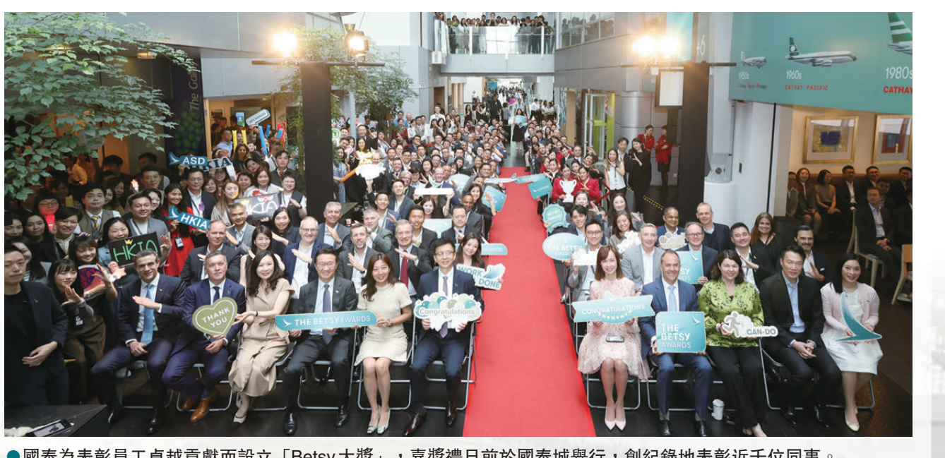
●國泰為表彰員工卓越貢獻而設立「Betsy大獎」，嘉獎禮日前於國泰城舉行，創紀錄地表彰近千位同事。