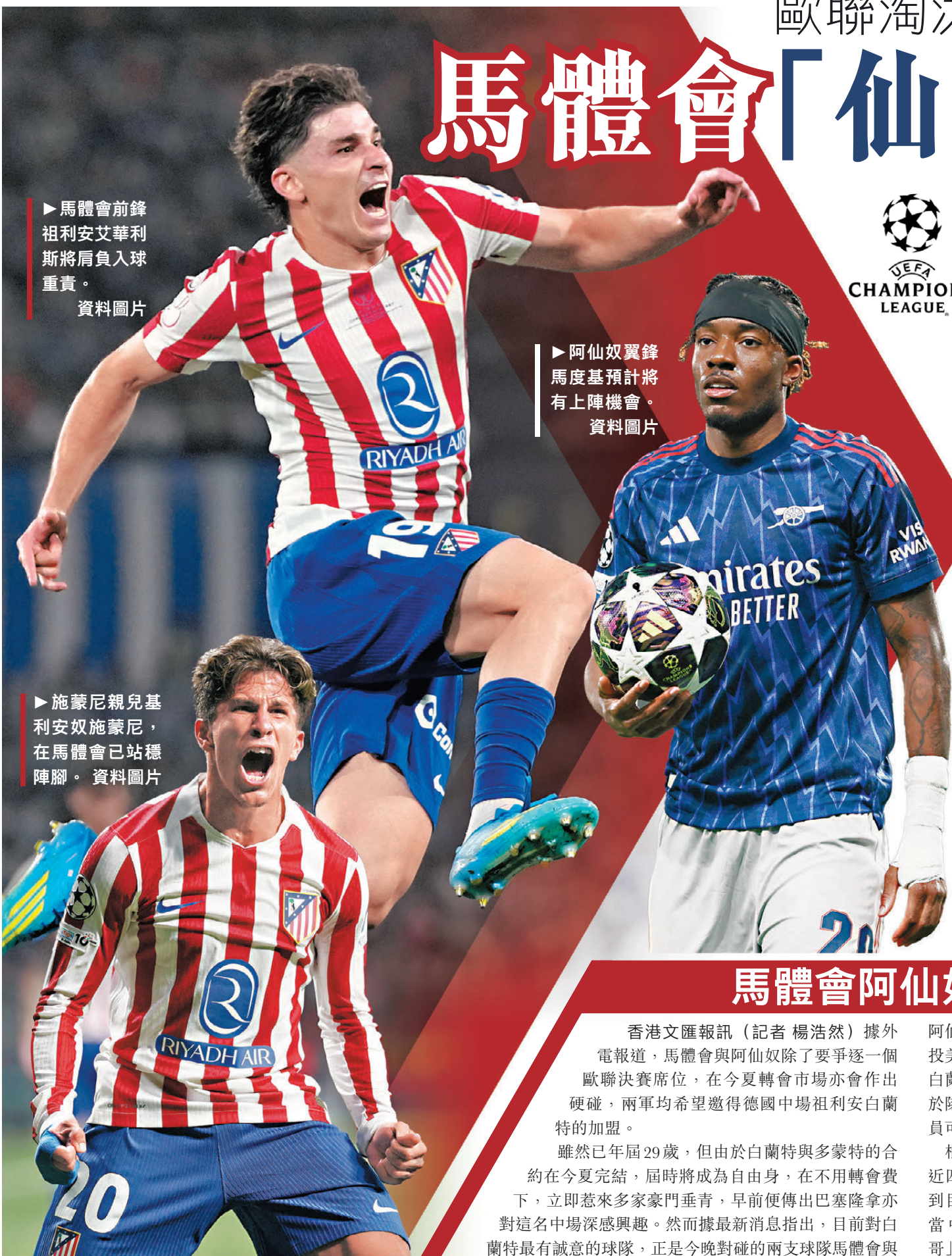
▶馬體會前鋒祖利安艾華利斯將肩負入球重責。資料圖片