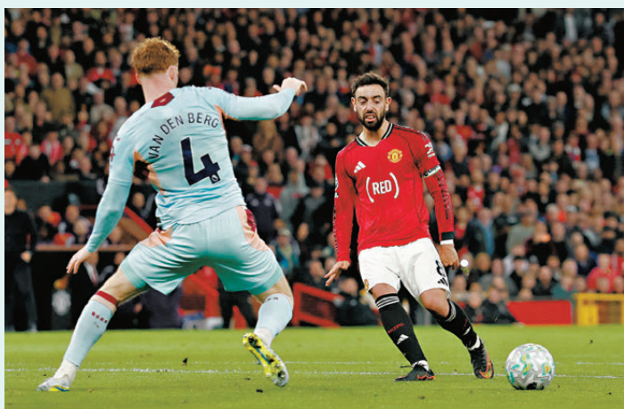
●般奴費南迪斯(右)是役再交出一記助攻。