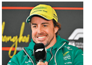
●阿朗素對自己能力仍甚有信心。資料圖片

香港文匯報訊(記者 楊浩然)兩屆一級方程式(F1)世界冠軍阿朗素表示，自己雖然已年屆44歲，但對賽車運動依然充滿熱情，加上感覺自己依然具備競爭力，故希望明年能繼續車手生涯。目前效力雅士頓馬田車隊的阿朗素，與車隊的合約在季尾完結，但由於表現依然出色，故預計有機會續約留隊。