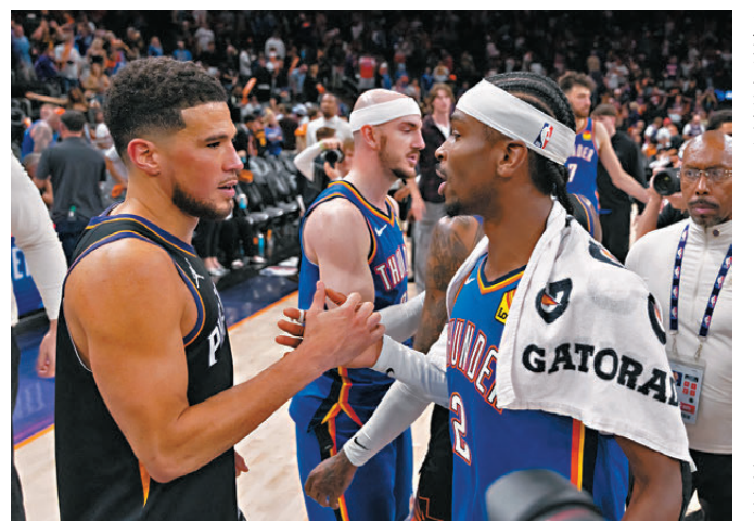
●阿歷山大(右)賽後與太陽主將迪雲布

香港文匯報訊(記者 楊浩然) NBA昨日上演三場季後賽，其中衛冕的雷霆作客以131:122擊敗太陽，直落四場橫掃對手勇闖西岸四強。雖然場數大幅領先，但雷霆球員未有因此放軟手腳，開賽後已給予太陽極大壓力，隨着當家球星阿歷山大中壓哨三分，客軍半場已領先75:67。下半場，太陽始終無法收窄落後差距，就算主力如布魯克斯等不停得分追趕，對手總能及時作出回應，最終雷霆順利再下一城以直落四場橫掃對手。雖然晉級過程輕鬆，但阿歷山大賽後受訪時，依然對太陽有着甚高評價：「太陽的球員有着出色的個人能力，是一支具備天賦的球隊，我對他們只有發自內心的尊重。」同日比賽，已無退路的金塊主場以125:113擊敗木狼，場數追至落後2:3。至於東岸「一哥」活塞作客以88:94不敵魔術，場數落後至1:3，未來必須連贏三場才能來後上晉級。是役表現平平僅得12分的活塞主力積倫杜連，賽後失望地表示：「對手不停利用我們的失誤取得分數，這情況在今個系列賽不停出現，我們如果想證明自己較對手優秀，餘下比賽便一定要作出大幅改善。」另一方面，NBA昨日官宣，今季場均取得21分、6.7個籃板、4.5次助攻的獨行俠前鋒谷巴費治，榮膺本年度最佳新秀。根據資料，獲得56張第一選票和44張第二選票的谷巴費治，是繼勒邦士後，第二年輕的NBA年度最佳新秀。