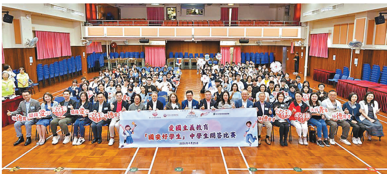
●愛心全達慈善基金舉辦「國安好學生」中學生問答比賽。

民政事務總署其後在社交平台表示，今次活動充分彰顯「官、民、教」協同合作的力量，將慈善組織的資源和教育界的專業相結合，透過具互動性、啟發性及趣味性的形式，令學生可以在輕鬆氛圍下，加深對憲法、基本法及香港國安法的理解，推動知識由「認知」轉化為「認同」層面，培養對國家的責任感和歸屬感，確立正確價值觀。