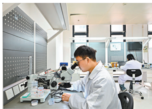
●專家表示，建設科技強國，中國不怕「棒殺」打壓，也要警惕「捧殺」。圖為早前在天津濱海高新區新智感知科技產業園的一處實驗室，工作人員對產品進行測試。資料圖片

孫玉濤表示，中國在研發投入規模上距離美國還有較大差距，加上科研人員數量中國比美國多出很多，人均研發費用相對就更少。此外，科學進步也並非僅僅由研發費用投入推動，還取決於創新體系的效率。與美國以市場為導向的模式相比，中國