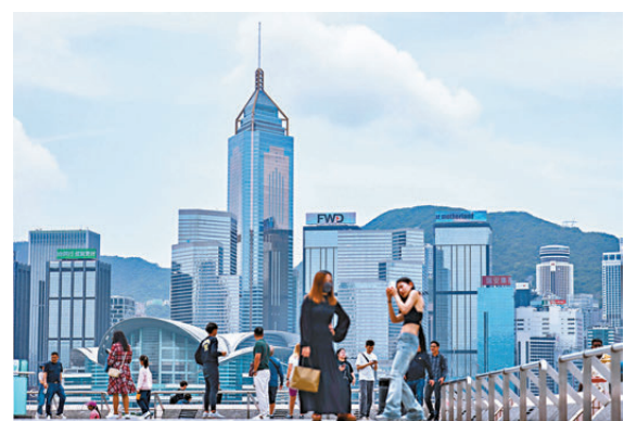
●金管局昨發布《2025年年報》。

在普羅大眾關心的消費者保障方面，年報亦帶來好消息。通過推出「智安存」防騙服務、修例容許銀行間分享賬戶資料，以及與科技電訊公司合作推