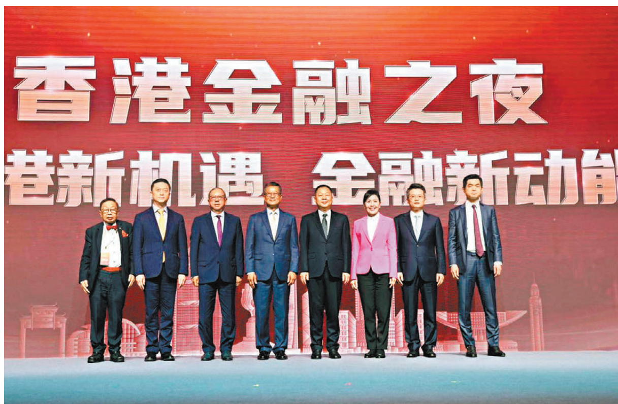
●「央視財經金融強國—香港金融之夜」昨在港舉行，多位重量級財金界人士在活動中探討香港如何在「十五五」時期，為國家金融強國建設貢獻力量。

陳茂波表示，面對人工智能等前沿技術快速發展，以及國家推動新質生產力和現代化產業體系建設，金融不僅要提供資金通道和融資平台，更要建立覆蓋初創、企業成長以至產業形成的全周期金融基礎設施和生態系統，包括天使基金、風投、私募基金、耐心資本及上市融資等完整資金鏈，並透過知識產權融資等方式，支持創新企業把無形資產轉化為營運資金。