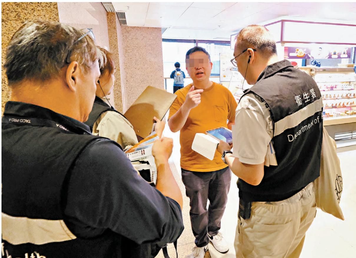
▲▼一名身穿橙色T恤男煙民因吸食加熱煙而被查獲，加熱煙被充公。

問： 若電子煙是由外地醫護人員/藥劑師配發作戒煙之用，可否豁免？ 答： 沒有豁免。如有需要，在港期間可使用已在香港註冊的戒煙藥物。