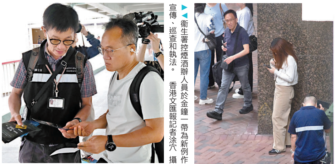
宣傳、巡查和執法。

他最後呼籲仍在用電子煙或加熱煙的人士盡快戒煙，可致電綜合戒煙熱線1833183，由專業護士提供輔導、藥物或中醫針灸等免費戒煙服務。