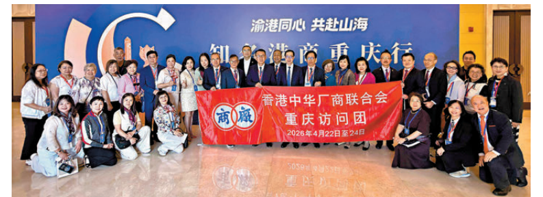
●廠商會早前組團赴重慶訪問。

香港文匯報訊 香港中華廠商聯合會於4月22日至24日組織近40人訪問重慶。其間，重慶市委書記袁家軍與廠商會會長盧金榮會面交流，雙方就深化渝港產業合作、推動港企赴渝投資發展等議題交換意見。