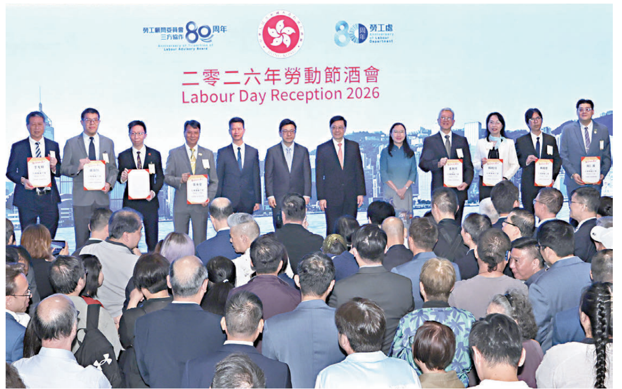
●李家超、孫玉菡、劉焯、許澤森與多名行業模範之星得獎者合照。

酒會上，李家超、立法會主席李慧琼、勞工及福利局長孫玉菡、勞福局常任秘書長劉焯、勞工處處長許澤森，多名立法會議員，以及勞工界、飲食界、零售界、法律界代表等逾500人，舉杯祝願香港打工仔勞動節快樂。