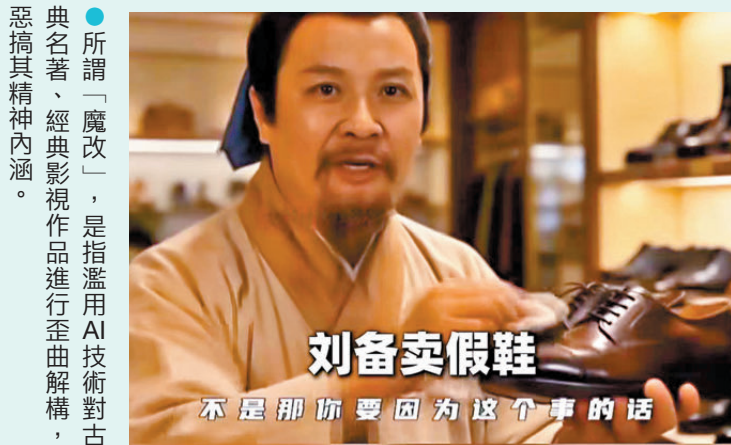
●所謂「魔改」，是指濫用AI技術對古典名著、經典影視作品進行歪曲解構，惡搞其精神內涵。