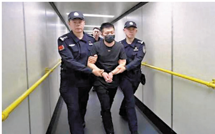
●天津公安機關4月29日成功將重大跨境網絡賭博案主犯黃某鎧從泰國引渡回國。

公開資料顯示，現年62歲的易會滿早年曾在中國工商銀行工作長達35年，先後在支行、分行和總行等多個層級的崗位上工作，歷任工行浙江省分行副行長、江蘇省分行行長、北京市分行行長等職，2013年開始擔任中國工商銀行行長。2016年，52歲的易會滿獲任中國工商銀行黨委書記、董事長。2019年1月，易會滿接替劉士余，被任命為中國證監會黨委書記、主席，成為證監會第九任主席。2024年2月，尚不滿60歲的易會滿被免去證監會主席職務，由時任上海市委副書記、政法委書記吳清「北上」接棒。當時正值中國股市大幅下跌，滬深300指數觸及五年新低，機構和散戶投資者紛紛止損。同年6月，他被增補為十四屆全國政協委員，出任經濟委員會駐會副主任。去年9月6日，易會滿被查。