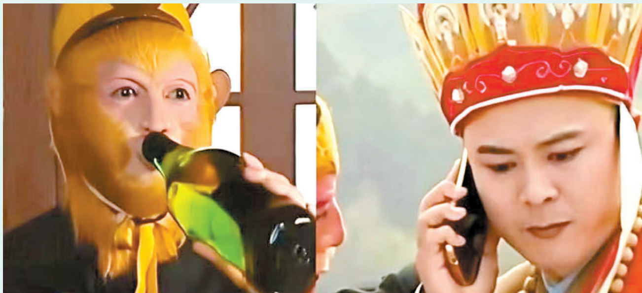
●中央網信辦4月30日通報，近日啟動為期4個月的「清朗·整治AI應用亂象」專項行動。圖為AI魔改版的西遊記。

中央網信辦有關負責人強調，各地網信部門要充分認識專項行動對於推動AI應用規範有序發展、維護網民合法權益的重要意義，切實履行屬地管理責任，督導網站平台對照整治重點，深入自查自糾，全面排查問題漏洞，完善長效治理機制，有效提升技術防治能力，確保專項行動取得實效。