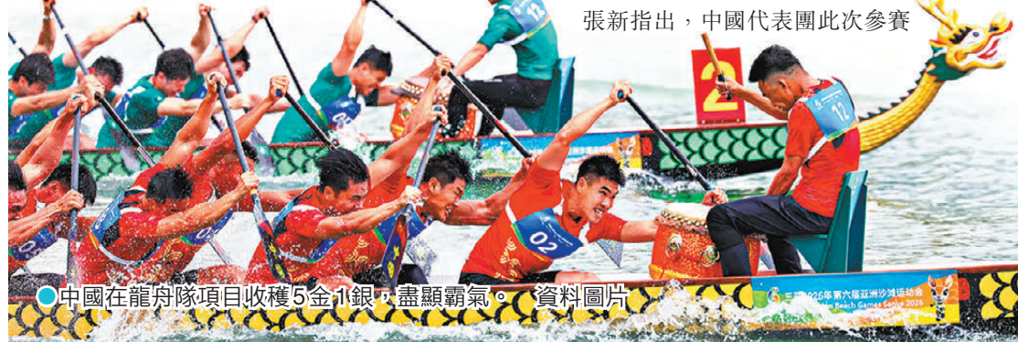
●中國在龍舟隊項目收穫5金1銀，盡顯霸氣。資料圖片

以專業隊為主，同時廣泛吸納社會力量，充分體現了體教融合、全民健身的成果。他補充指更為深遠的影響是，一大批年輕選手首次登上國際綜合性賽事舞台，在高水平對抗中積累了寶貴經驗，為未來走向更大賽場打下基礎，「賽事也為三亞留下了項目文化遺產，提升了賽事組織能力，培養了一批競賽組織和對外交流人才。」