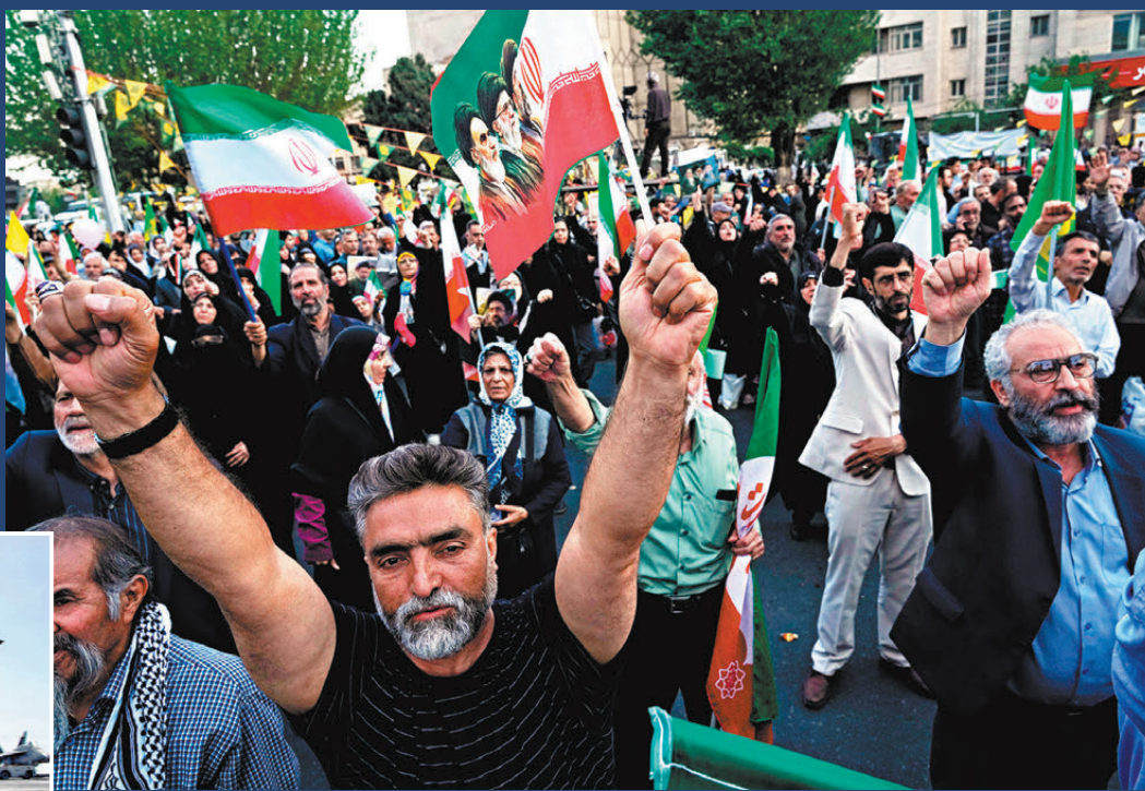
▲4月29日，在伊朗首都德黑蘭，大批民眾走上街頭參加遊行集會，展示國家團結。