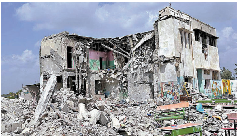
●在美以空襲中被摧毀的伊朗南部米納卜市小學，最少165人喪生，大多數為女學生。資料圖片

特朗普2020年在其首個任期內，曾宣布大幅削減駐德美軍，並指責德國在北約軍費分擔中貢獻不足。目前美軍歐洲司令部與非洲司令部均設在德國斯圖加特，德國拉姆施泰因空軍基地則是美國在中東、北非和南亞軍事行動的主要後勤基地。據美國國防部數據，2025年底，美軍共有超過3.6萬人駐紮在德國。