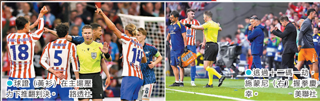
●球證（黃衫）在主場壓力下推翻判決。