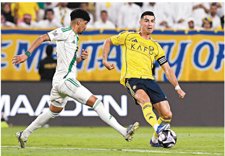
●C朗拿度（黃衫）為艾納斯先開紀錄。

香港文匯報訊（記者 葉詩敏）沙特聯爭冠進入白熱化階段，「領頭羊」艾納斯於周四凌晨（4月30日）的主場大戰中，憑藉葡萄牙巨星C朗拿度及京士利高文於末段各建一功，以2：0擊敗剛奪得亞冠盃冠軍的吉達艾阿里。艾納斯目前在各項賽事豪取20連勝，於榜首遙遙領先，C朗距離加盟後的首座正式賽事錦標僅一步之遙。