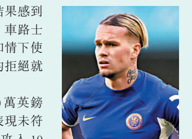
●梅迪歷遭英足總重罰禁賽四年，職業生涯面臨重創。資料圖片

梅迪歷於2023年1月以高達8,800萬英鎊的身價由薩克達加盟車路士，可惜表現未符身價，至今代表球會上陣73場僅攻入10球，始終未能穩佔正選位置。他最後一次為車路士上陣已是2024年11月底對海登威的歐協聯賽事，若最終維持四年禁賽原判，其職業生涯恐面臨毀滅性打擊。