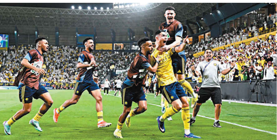
●C朗拿度（黃衫）入球後與隊友擁抱慶祝。

賽後亦出現了一段有趣的小插曲。心情大好的C朗在場邊接受訪問時，遭到吉達艾阿里的球迷挑釁。由於客軍連續兩年贏得亞冠盃冠軍，支持者紛紛向其炫耀獎盃，這名葡萄牙球星隨即施展「神反擊」，他笑着向看台舉起五隻手指並高呼：「我有五個歐聯冠軍，我有五個，五個！」以此提醒對手誰才是真正的冠軍收割機，令對方頓時啞口無言。艾納斯接下來將雙線作戰，力爭成為聯賽及亞冠2的「雙冠王」。