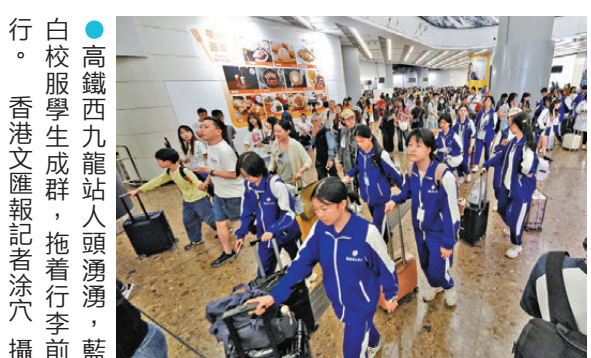
白校服學生成群，拖着行李前行。

內地五一黃金周期間，有不少旅客安排了在港的各項活動，長沙一間中學就特意舉辦遊學團，來港參觀及與本地中學交流。該校交流營的負責人之一劉小姐向香港文匯報記者表示，香港學生早到內地進行交