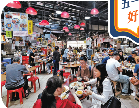
熟食中心，紅燈罩下食客滿座，盡顯地道風味。