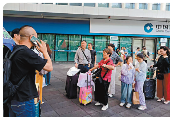
●港人家庭團去深圳遊玩。

斷優化通關服務，大幅提升兩地人員往來便利度。業內人士表示，經深圳口岸赴港行程靈活、出行成本低，深受中老年遊客及首次赴港遊客青睞，經典景點依舊是遊客核心選擇，也帶動香港旅遊市場持續回暖。