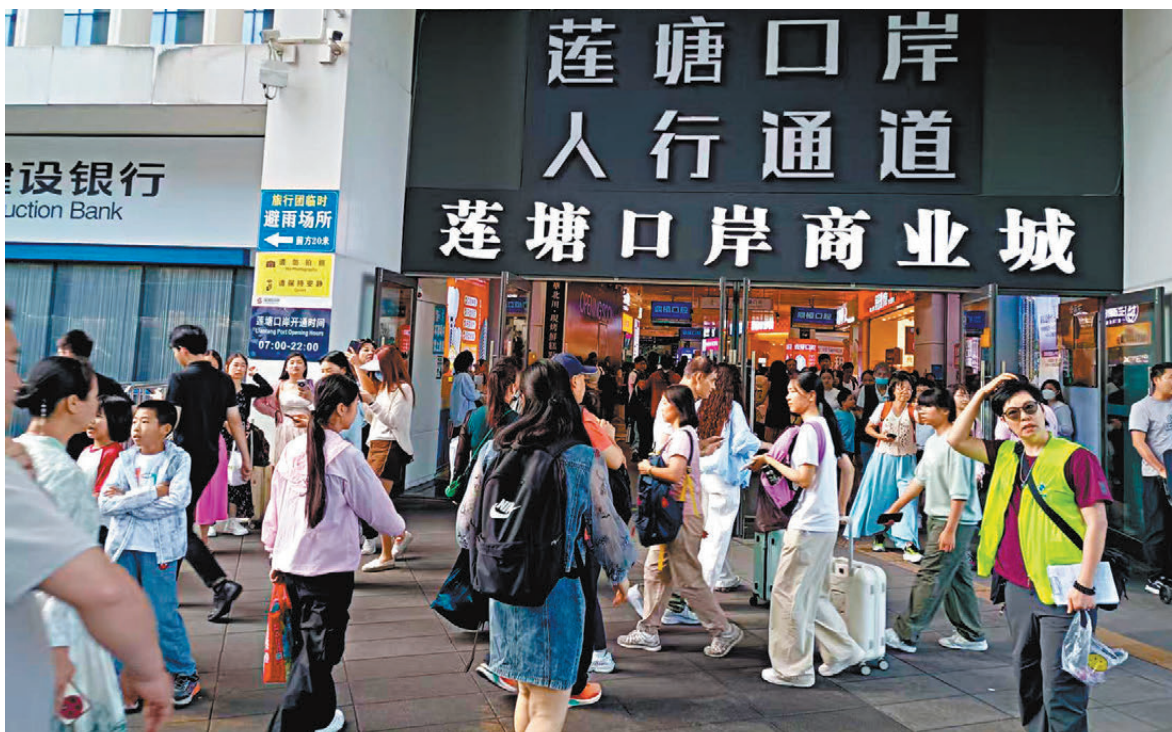
●大量遊客與家人一起赴港遊玩。

來自上海的年輕遊客專程拼假赴港，計劃深度遊覽市區景點、品嚐特色美食，而湖南旅客劉女士則帶著老人及孩子選擇短途團，主打休閒觀光與美食體驗。上海95後旅客小陳和朋友已排隊近半小時，「我們請了兩天假，拼出七天長假，打算從東涌一路玩到銅鑼灣，不僅要逛維多利亞港，還要去吃之前刷到的米芝蓮小麵店，排隊久一點也沒關係。」來自湖南的劉女士帶同父母和5歲孩子報了兩天的短途團，「老人一直想去香港看看，這次特意趁長假帶他們過來，準備先去星光大道逛逛，再嘗嘗港式早茶。」有廣州旅客亦組團結伴赴港，趁黃金