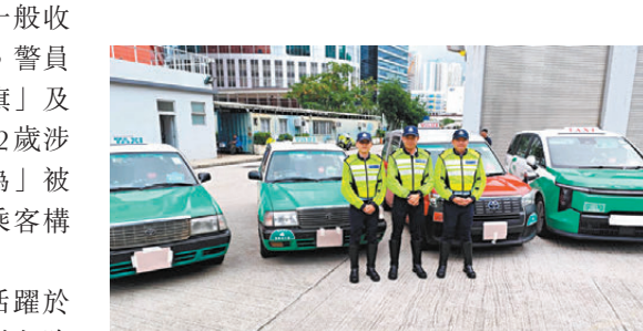
●警方打擊西貢東壩黑的。

據了解，警員在東壩登土往打鼓嶺香園圍口岸，司機途中在狹窄繁忙的道路上左穿右插，駛入主幹道後車速明顯較快，在馬鞍山繞道一度時速達160公里，故以涉嫌「危險駕駛」拘捕該名31歲梁姓司機，他獲准保釋候查，本月下旬向警方報到。由於有人在網上聲稱替的士改裝，警方扣留的士檢驗，並跟進網上涉嫌危險駕駛片段。 警方表示高度重視的士濫收車資案件，今年2月農曆新年期間，在東壩的執法行動中有7名被捕司機已被定罪，各被判罰款3,000至6,000元，並在的士違例記分制度下被扣10分。警方強調，將繼續嚴厲打擊的士業界害群之馬，市民倘懷疑的士司機涉及危險駕駛、拒載、濫收車資等違法行為，可記下司機姓名、車牌、時間和地點，警方定必果斷執法。