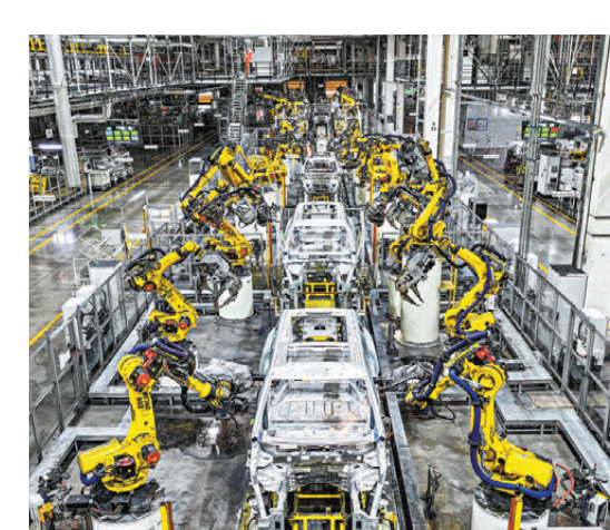
●位於重慶市兩江新區的賽力斯汽車超級工廠自動化生產作業現場。

及投運的數據中心已達50個，算力規模突破150EFLOPS，其中智算佔比超97%；綜合算力水平居全國前列。