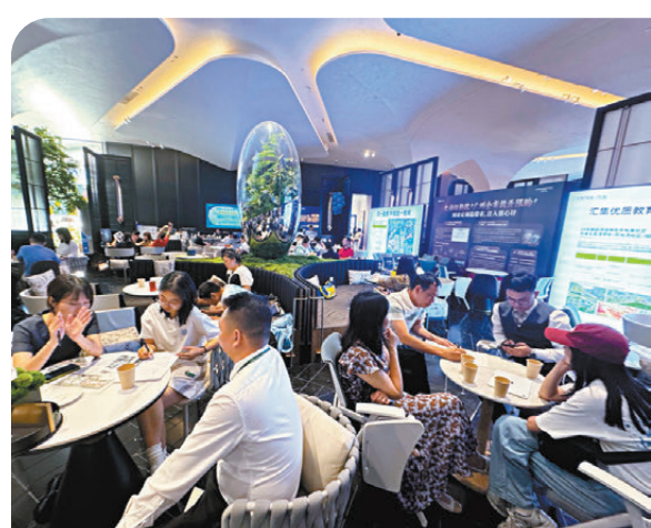
●圖為廣州一樓盤的銷售大廳。

香港文匯報訊(記者 盧靜怡 廣州報道)在中央政治局會議部署「努力穩定房地產市場」後，內地包括廣州、深圳、天津等多個城市近日再推穩樓市「組合拳」。廣州大幅鬆綁公積金貸款，發放置換補貼、購房家裝消費券等，還推出港澳居民來穗置業便利措施；深圳進一步放寬核心區限購；天津則實行改善型購房退稅等優惠措施。廣州提出，簡化港澳居民來穗置業的申請材料，提供按揭辦理便利，並開通資金結算綠色通道。同時，支持住房公積金跨境人民幣結算，進一步打通港澳居民在穗購房及資金流轉的關鍵環節。今年3月，全國首個住房公積金跨境人民幣結