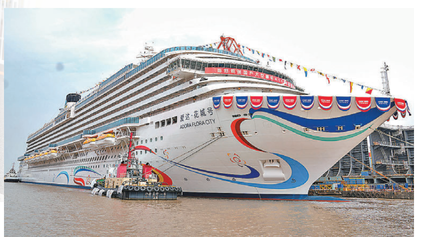
●第二艘國產大型郵輪「愛達·花城號」在上海出塢。