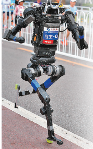
●杭U賽隊自主人形機器人選手宇樹H1在馬拉松比賽中。資料圖片