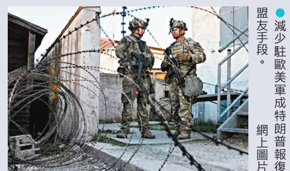
●減少駐歐美軍成特朗普報復盟友手段。 網上圖片