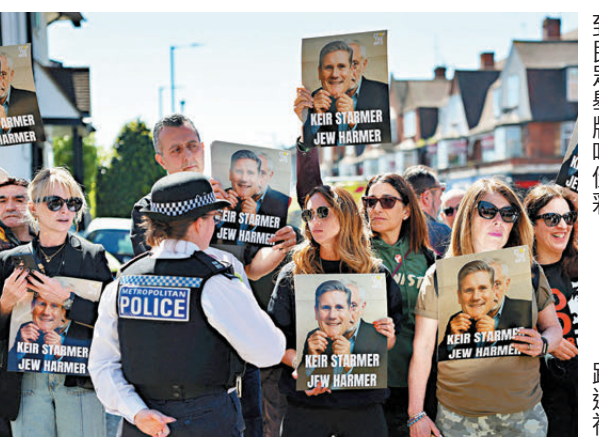
●斯塔默到襲擊案現場視察，其間遭到民眾舉牌喝倒彩。

路透社日前報道，一封五角大樓內部郵件顯示，對於未在對伊戰事中助美的北約盟國，特朗普政府已列出懲罰選項，當中包括暫停西班牙的北約成員資格。此外，消息指特朗普4月初曾與幕僚討論，從歐洲撤出部分美軍的可能性。特朗普30日被記者問到會否也考慮削減駐意大利和西班牙的美軍人數，他以「可能吧」回應，直言意大利在對伊戰事中對美國沒有任何幫助，而西班牙更是惡劣。 特朗普連日來與德國總理默茨隔空交火，特朗普曾批評默茨在伊朗議題的立場，直指對方「根本不知道自己在說什麼」，又指德國在經濟等多方面都表現欠佳。特朗普29日透過社媒稱，美國正考慮削減駐德美軍數目，短期內會有決定，翌日再發文稱：「德國總理應把更多時間花在結束俄烏衝突上，並修復他那個破碎的國家，尤其是解決移民和能源問題，而非干涉那些致力於消除伊朗威脅國家的行動。」德國外長瓦德富爾回應稱，針對特朗普威脅削減駐德美軍，德方已對此做好準備。