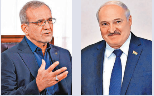
●佩澤希齊揚(左)與盧卡申科通話，通報伊方在美談判中的立場。 資料圖片

伊總統與白俄總統通話 佩澤希齊揚在通話中說，通過對話和外交努力解決分歧一直是重點，但在之前的談判過程中，美國和以色列曾兩次襲擊伊朗，類似行動可能會再次發生，這導致伊朗對美國完全失去信任。 據白俄羅斯總統網站30日消息，佩澤希齊揚在通話中向盧卡申科通報地區局勢及伊方在美談判中的立場，並對白俄羅斯秉持的原則性立場表示感謝。 雙方指出，達成和平協議的主要障礙在於缺乏互信。盧卡申科強調，白俄羅斯期待衝突盡快得到解決。 伊朗外交部發言人巴加埃出席電視節目時說，期待伊朗和美國談判迅速達成結果並不現實。他表示，伊朗伊斯蘭革命勝利47年來，伊朗對美方行為積累了深深的不信任和懷疑，強調不應期望談判在短時間內達成結果，「畢竟這是一場極其血腥的戰爭」。 巴加埃指出美國和以色列「極其殘酷」，過去兩年半在加沙地帶和黎巴嫩的衝突證明了這一點，「在這種情況下，無論調解人是誰，期望短時間內達成協議是不現實的。」