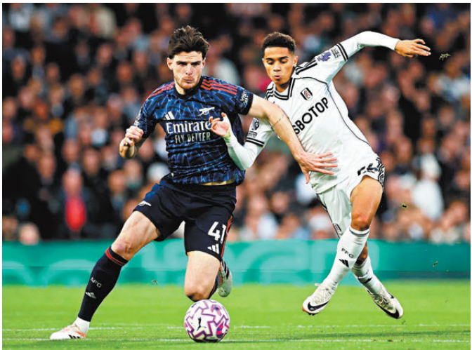
●阿仙奴(左)必須在富咸身上全取三分。資料圖片

紐卡索主場對白禮頓比賽(Now622台今晚10:00p.m.直播)。紐軍正式比賽五連敗，爭逐來季歐戰資格只餘下數字上可能。相比下白禮頓近況大勇，過去八輪聯賽豪取六勝，上輪三球淨勝車路士贏來清風送爽，是役該有力做到反客為主。