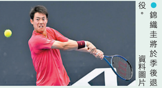
●錦織圭將於季後退役。資料圖片

香港文匯報訊 據中央社報道，日本網球名將錦織圭昨天在社群平台宣布將在季尾高掛球拍。他曾奪下2014年美國網球公開賽男子單打亞軍，並在隔年躍居世界排名第四位。錦織圭在社群平台X發文表示：「我從小就相當熱衷於網球，懷抱著『想在世界舞台上奮戰』的想法一路追逐夢想。而我也在這個過程中站上頂尖舞台，並一路攀升到世界前十，對我而言是極大的驕傲」。