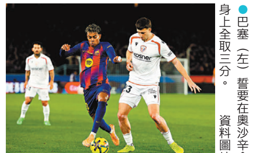
●巴塞(左)誓要在奧沙辛拿身上全取三分。

意甲是日焦點為科木主場對拿玻里(belN SPORTS CONNECT周日0:00a.m.直播)。科木落後第四位的祖雲達斯三分，如要爭逐來季歐聯入場券是役非勝不可，是役面對近三場聯賽僅一勝的「二哥」拿玻里，值得看高一線。