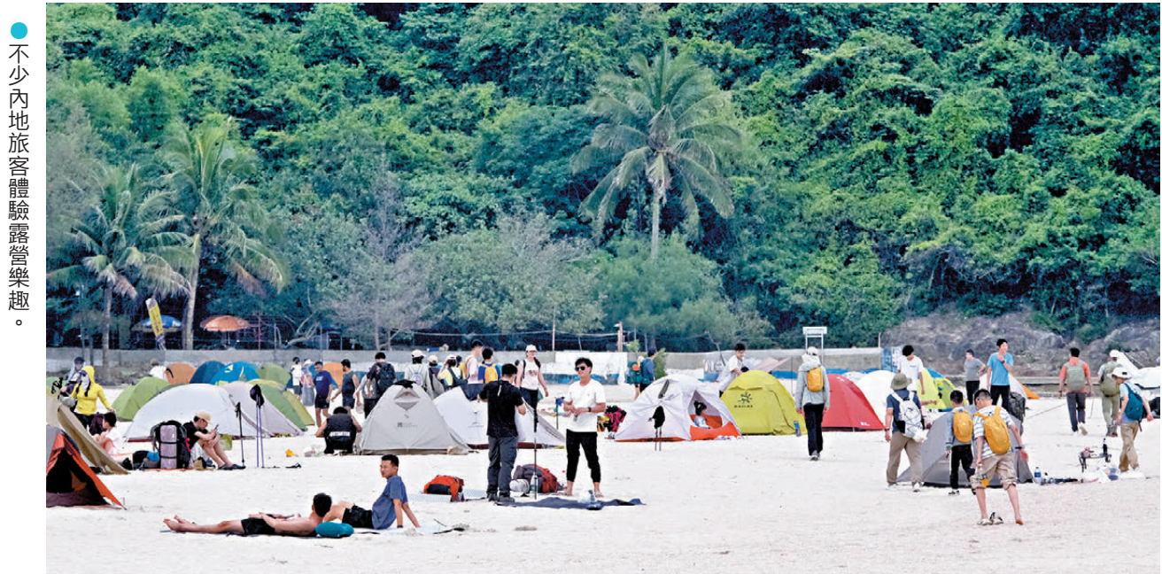
●不少內地旅客體驗露營樂趣。