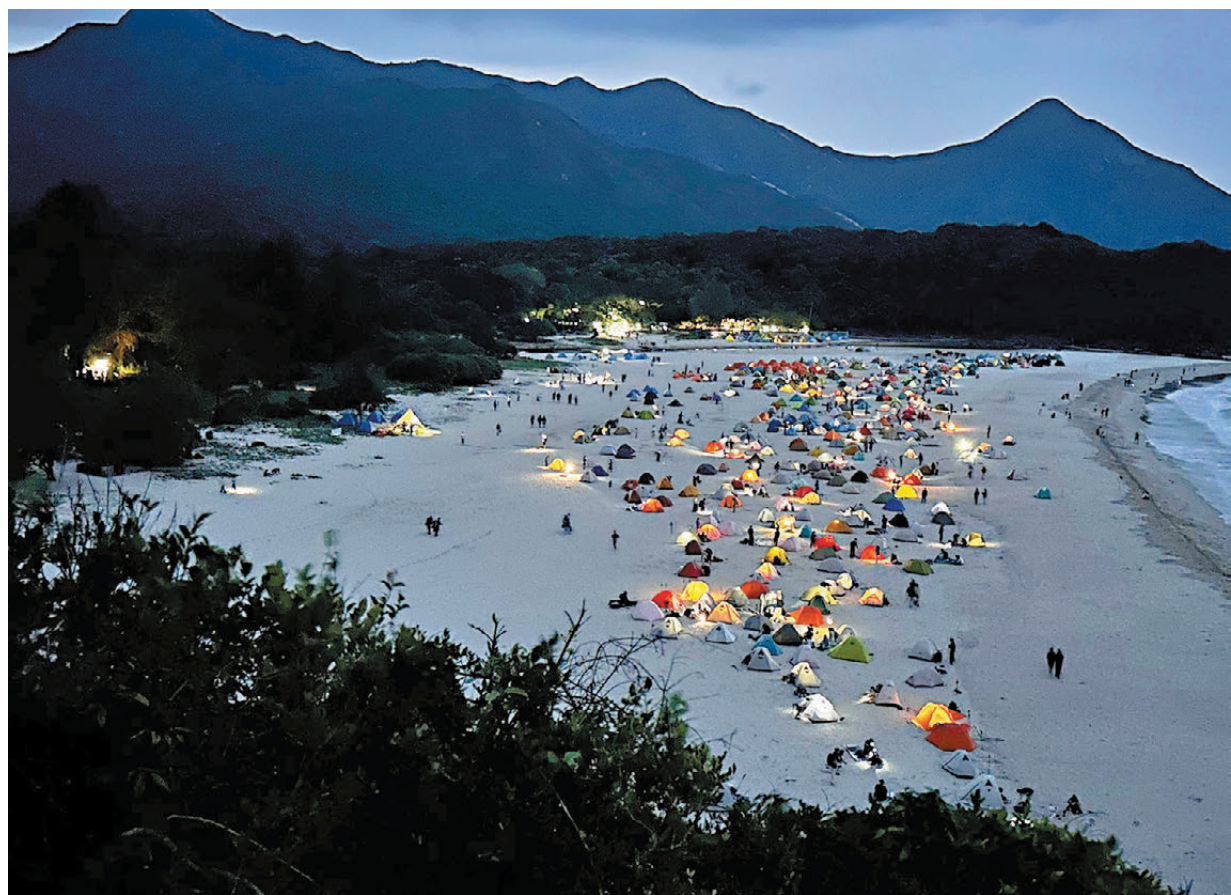
●鹹田灣營地5月1日晚狀況。