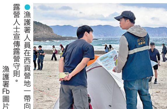
●漁護署人員在西貢營地一帶向露營人士宣傳露營守則。