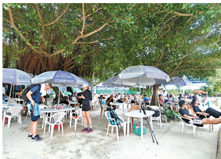
●不少旅客光顧鹹田灣的士多。