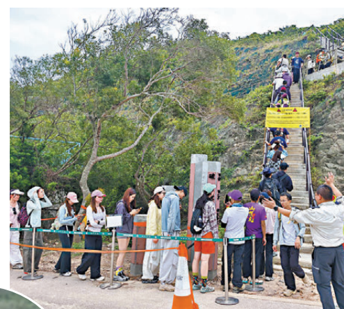
●漁護署人員5月1日在破邊洲實施人流管制措施。