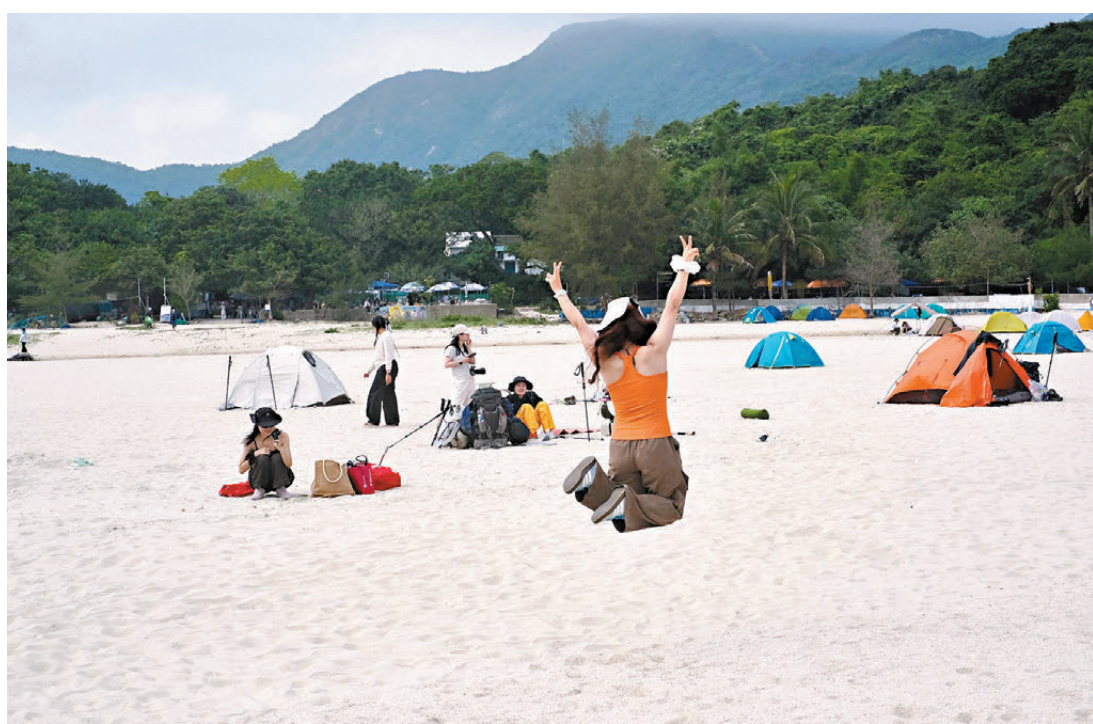
●遊客開心到手舞足蹈、伸開雙手「起飛」。