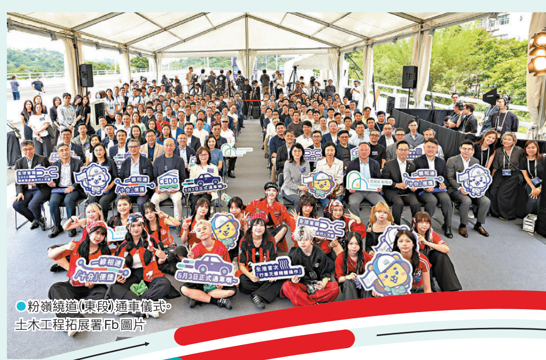
●粉嶺繞道(東段)通車儀式。