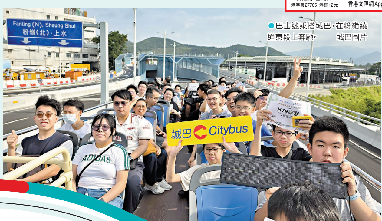
●巴士迷搭乘城巴，在粉嶺繞道東段上奔馳。