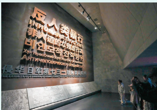
●人們在位於黑龍江省哈爾濱市的侵華日軍第七三一部隊罪證陳列館內參觀。

抗戰檔案》申遺之路從一開始就布滿荊棘。2014年，《慰安婦》問題相關檔案首次申報《世界記憶名錄》，2015年落選，2017年再次申報卻被推遲入選，陷入無限期對話。2019年，《日本細菌戰檔案》提出申報，至今無實質進展。而2015年成為關鍵轉折點——當年《中國南京大屠殺檔案》成功入選《世界記憶名錄》，時任日本首相安倍晉三隨即發表戰後70周年談話，直接表示不能讓與戰爭毫無關係的孫子後代背負不斷謝罪的宿命。