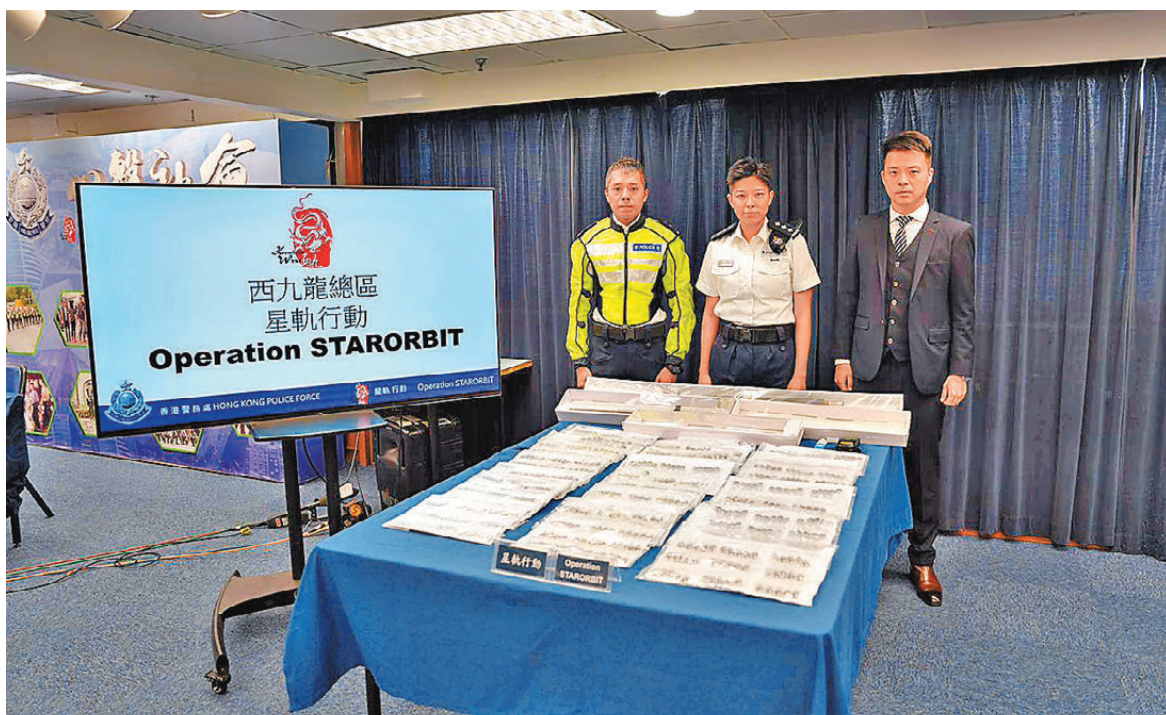
●警方展示「星軌」行動中檢獲的武器及毒品等證物。

另在行動中,人員在西九龍區內多個地點設置路障截查可疑車輛,共拘捕8名(21歲至58歲)本地