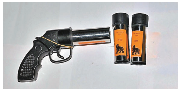
●檢獲的懷疑槍械和彈藥。