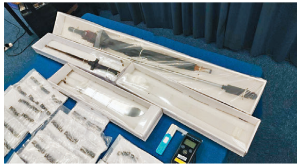
●行動中檢獲的牛肉刀和伸縮棍,其中一支伸縮棍更經改裝裝在一把雨傘內。