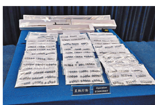
●警方在行動中檢獲大量依托咪酯煙彈。

同時,人員在巡邏期間截停一名28歲男司機進行快速口腔液測試,發現其體內含有懷疑氯胺酮(K仔)及可卡因,另藏有多張他人的信用卡,涉嫌藥後駕駛及盜竊罪被捕。