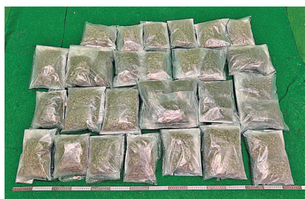
●圖為於其中一宗案件檢獲估計市值共約120萬元的懷疑大麻。

第三宗案件涉及一名昨日從馬來西亞檳城飛抵本港的29歲男旅客。海關人員清關時,在其手提行李內發現約4.6公斤懷疑海洛英,估計市值共約280萬元,遂把他拘捕。