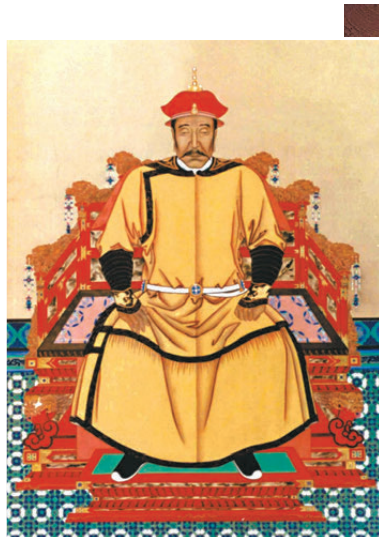
▲努爾哈齊像 資料圖片

許多的心理學家與兒童發展學者都認為，競爭不完全是負面之事。只要引導得當，適度的競爭對認知、韌性與心性的發展都有助益。但是，如果家長未能掌握孩子的能力與個性，無論是施加過高的壓力，還是過度放任、鼓勵「躺平」，都可能對孩子的心性成長帶來不良影響。