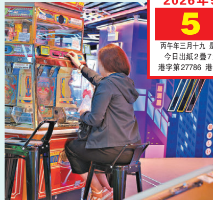
●不少人沉迷玩代幣遊戲，經常課金。資料圖片