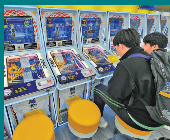
●近年市面出現了例如彈珠機等有獎遊戲，吸引許多青少年光顧。

第二項方案是訂立類似現時規範「電子競技場地」的制度，讓網吧在符合政府提出的嚴格條件下申請豁免免領遊戲機中心牌照，但要逐一申請豁免，不會因經營網吧而自動獲得豁免。局方建議網吧須符合樓宇、消防、通風等安全規定，並形容機制屬於平衡做法，既讓政府可通過審批和施加合適的規管條件（如不得提供住宿服務），又避免沿用針對傳統遊戲機中心的牌照條件，例如對進場人士的年齡限制對營運模式帶來的規限，或較易平衡業界的需要及對處所安全的要求。