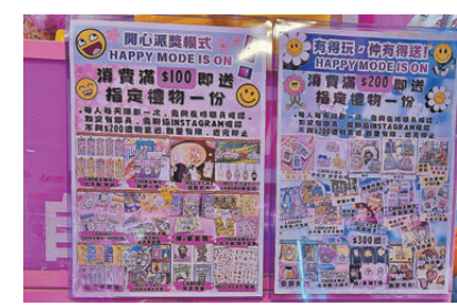
●夾公仔店玩法五花八門。

牌照事務處於2021年至2025年接獲有關夾公仔機的舉報中，涉及懷疑有非法賭博元素的個案分別有5宗、2宗、6宗、5宗及2宗。另外，海關也接獲有關夾公仔機涉嫌違反《商品說明條例》（第362章）的舉報，從2022年16宗升至2025年171宗，其間共有4宗檢控個案，3宗被判定罪。