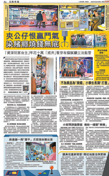
●香港文匯報過往相關報道。香港文匯報 PDF 版面