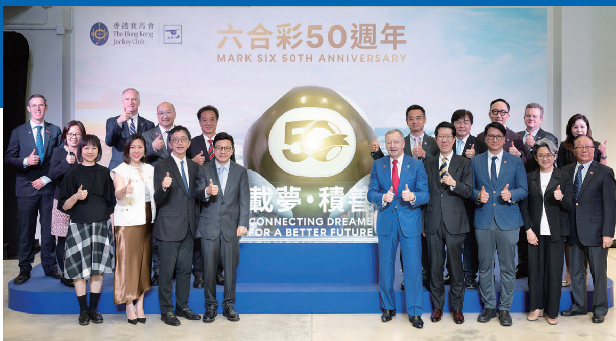
▲香港特區政府勞工及福利局局長孫玉茜(一排左四)、馬會行政總裁應家柏(一排右五)與一眾嘉賓及馬會管理層合照。

展覽優先發售六合彩50周年紀念商品，當中部分商品更為展覽獨家，售完即止。非展覽獨家商品將由5月17日起，在指定馬會場外投注處的「馬場有禮」專櫃、「馬場有禮」門店及網店公開發售。