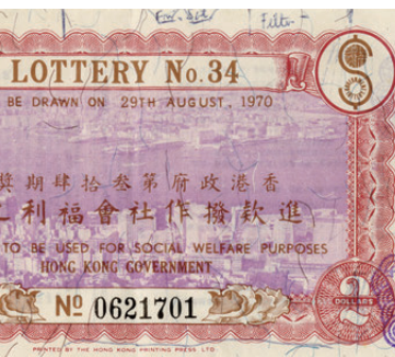
▲展覽展出六合彩文物，圖為1970年政府獎券。(馬會名譽遴選會員鄧思高先生捐贈)

馬會特設主題網站，讓市民了解六合彩的重要里程碑，對社會的重大貢獻，以及一系列有趣冷知識，例如史上單期最多頭獎中獎注數、歷來攪出次數最多的號碼、頭獎的中獎機會率等，歷史、資訊、娛樂並重。