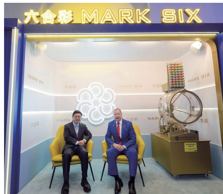
▲香港特區政府勞工及福利局局長孫玉茜(左)和馬會行政總裁應家柏(右)與六合彩退役攪珠機合照。