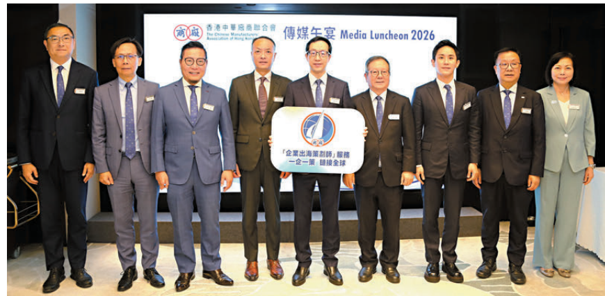
●廠商會昨日宣布推出「企業出海策劃師」服務。

在港「試水溫」的絕佳平台，進而以香港作跳板躍身國際。此外又將於下月再度與多家機構合辦「2026國際汽車及供應鏈博覽會」，向全球買家展現中國汽車產業及供應鏈的頂尖實力。