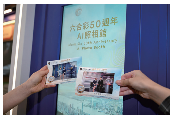
▲參觀者可在「六合彩50周年展覽」與退役攪珠機拍攝即影即有照片留念。