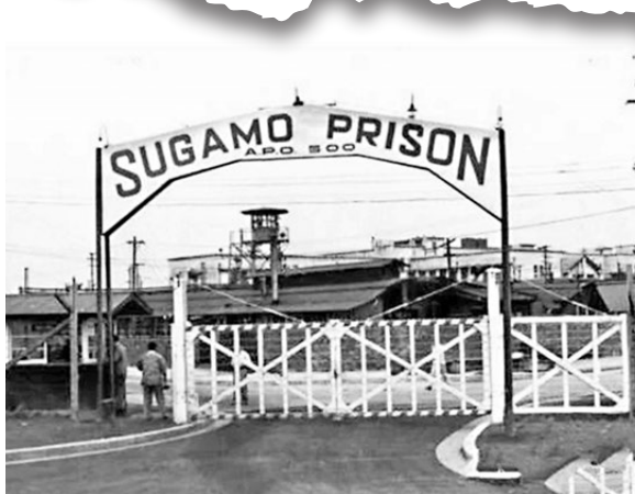
●巢鴨監獄外景。

內海說，在這一過程中，日本逐漸形成一套新的荒謬邏輯：戰犯審判屬於盟國的審判，而非日本自